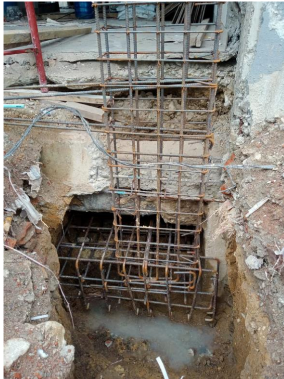
Gambar 4. Rakit Besi Tulangan