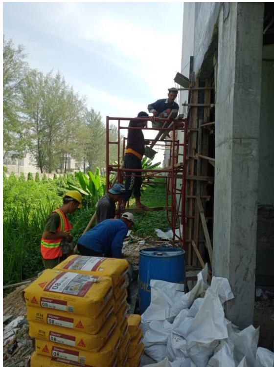
Gambar 6. Pengecoran Material Perkuatan