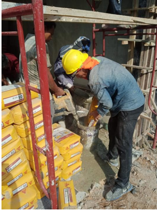
Gambar 5. Material Beton Perkuatan