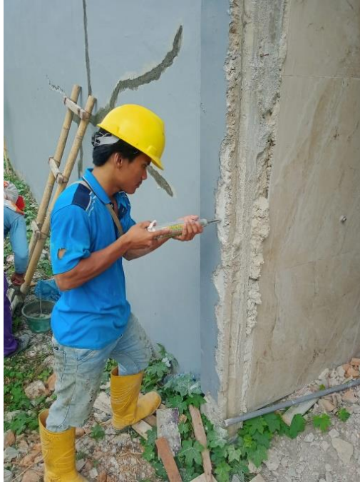
Gambar 3. Uji Bangunan Eksisting