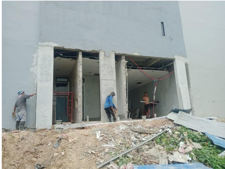
Gambar 7. Penyelesaian Pekerjaan