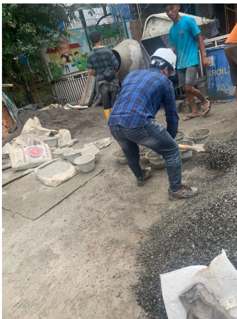
Gambar 10. Kontrol Campuran beton