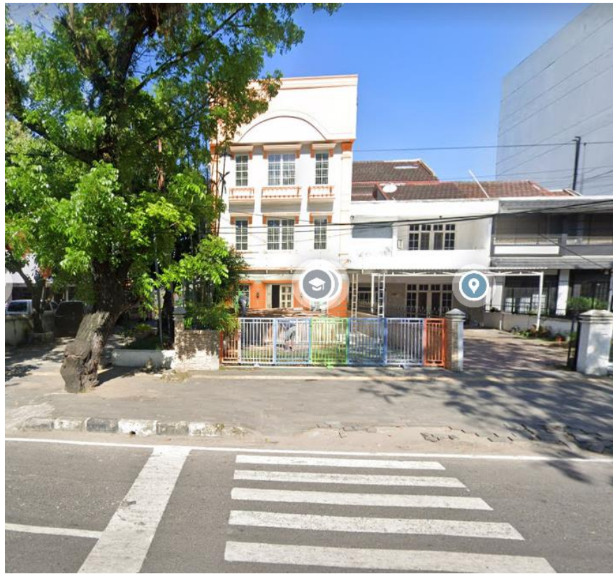
Gambar1. Awal bangunan eksisting Jl S Parman 22B Medan

cukup mengkhawatirkan oleh karena itu, Mitra memerlukan pendampingan dalam segi teknis dalam desain dan perkuatan struktur.