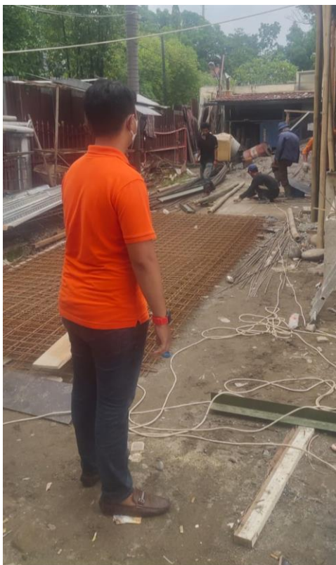
Gambar 9. Pendampingan di Lapangan