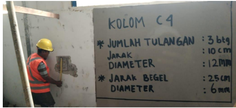
Gambar 5. Penyelidikan Tulangan Eksisting