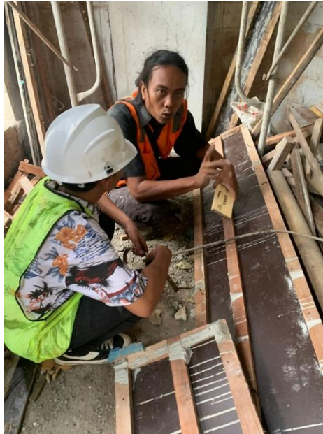
Gambar 8. Briefing On site

Tim melakukan pendampingan berupa, control terhadap pemakaoan material ataupun pemasangan material, Koordinasi dilakukan setiap hari pada pelaksanaan konstruksi di lapangan. Dokumentasi kegiatan seperti yang ditunjukkan di bawah ini.