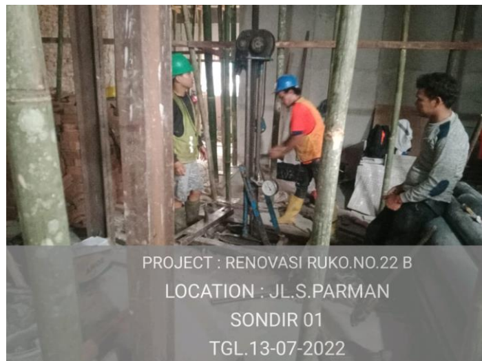
Gambar 4. Penyelidikan Tanah Eksisting