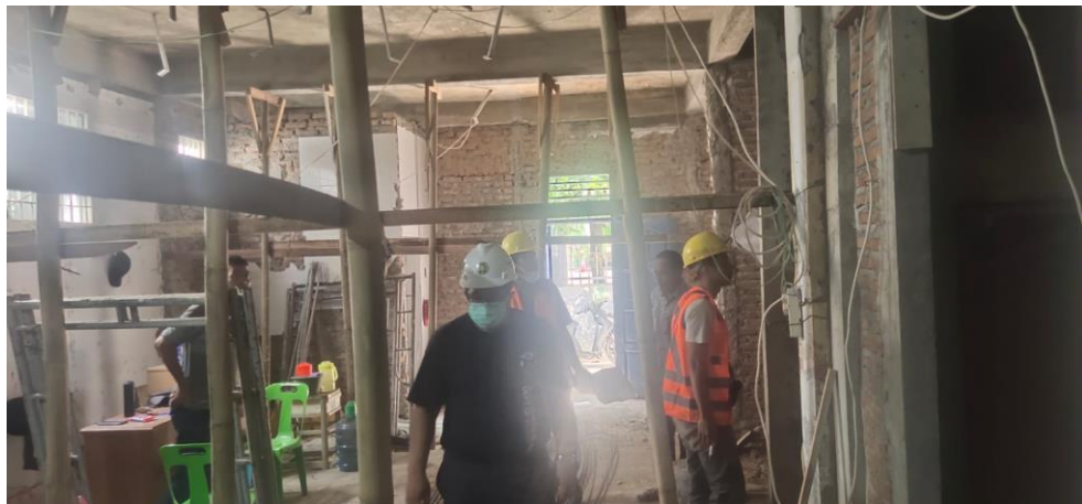
Gambar 2. Terjadi lendutan balok, maka bangunan segera disokong dengan kayu dan bambu