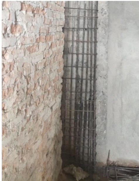
Gambar 6, Jacketing kolom