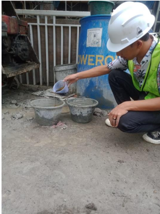
Gambar 11. Penambahan Aditif