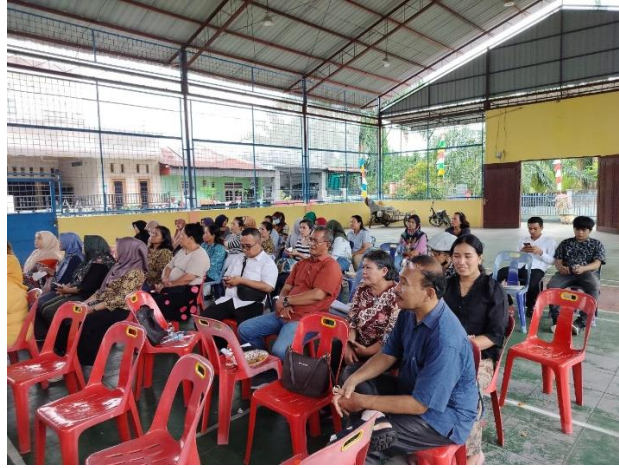
Gambar 4. Antusiasme Ibu-Ibu PKK Desa Perumnas Simalingkar

Kegiatan akhir yaitu pemberian reaktor komposter aerob kepada Ibu-Ibu PKK Desa Perumnas Simalingkar Kecamatan Pancur Batu. Tim pengabdian juga memberikan mikro organisme berupa EM4 dan mol yang telah dibuat sebelumnya oleh tim pengabdian kepada masyarakat untuk dimanfaatkan oleh pihak Ibu-Ibu PKK Desa Perumnas Simalingkar Kecamatan Pancur Batu.