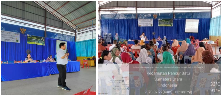
Gambar 3. Pengenalan mikro organisme lokal (MOL) dan komposter

anorganik diharapkan menumbuhkan kesadaran Ibu-Ibu PKK Desa Perumnas Simalingkar Kecamatan Pancur Batu untuk membuang sampah pada tempatnya dan dapat mengolah/menggunakan kembali (reuse) sisa sampah organik untuk dimanfaatkan menjadi pupuk kompos.