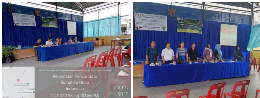
Gambar 2. Perkenalan tim pengabdian Universitas Quality dengan pengurus dan Ibu-Ibu PKK Desa Perumnas Simalingkar Kecamatan Pancur Batu

Pengenalan awal bersama pengurus Ibu-Ibu PKK Desa Perumnas Simalingkar Kecamatan Pancur Batu untuk mendapatkan simpati awal dari peserta dan tujuan kedatangan tim pengabdian kepada masyarakat. Selanjutnya kegiatan awal yakni pengenalan akan sampah organik yang berasal dari sampah rumah tangga berupa bahan-bahan sisa yang tidak digunakan lagi yang berasal dari tumbuh-tumbuhan. Sampah organik bisa berasal dari kulit singkong, kulit pisang, kulit bawang, sayuran sisa, sampah batang tebu, jerami padi, daun-daun yang gugur dan layu, kulit buah-buahan, sampah dari sisa dapur lainnya. Sementara sampah anorganik yaitu sisa plastik, kaca, besi, kaleng dan bahan bahan yang tidak dapat terurai oleh mikro organisme. Pengenalan akan sampah organik dan sampah