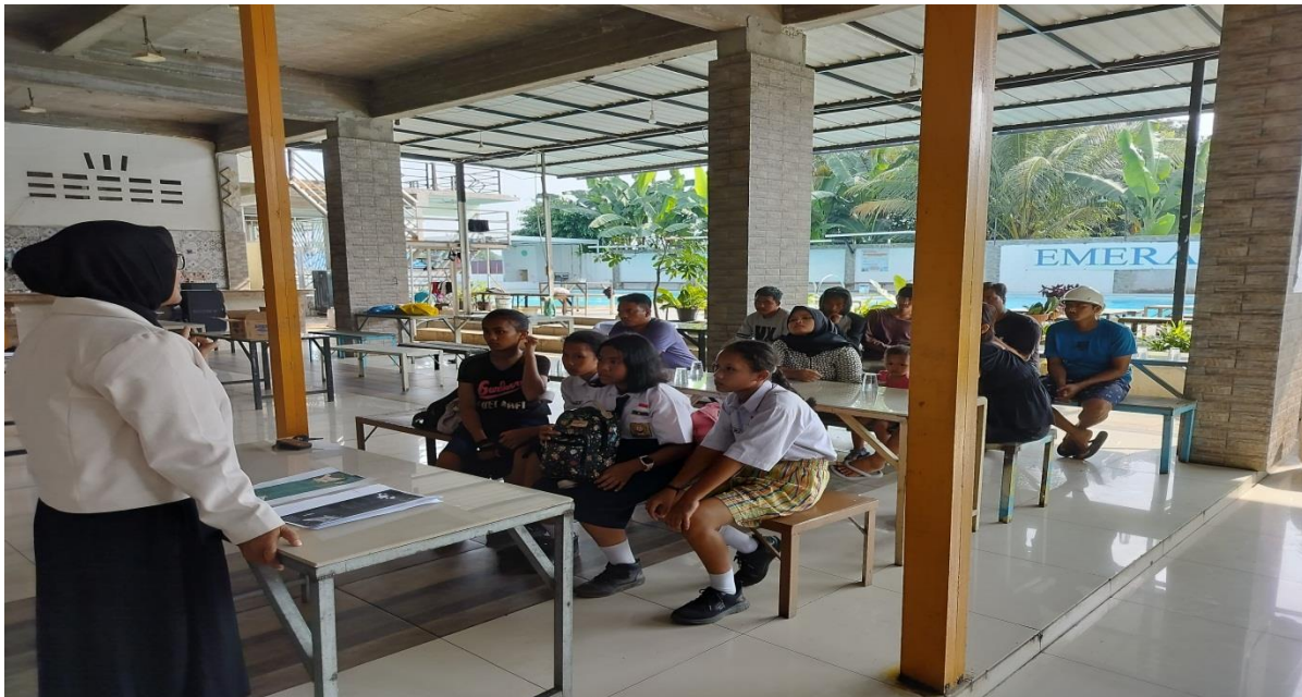
Gambar3. Perkenalan dengan mitra pengunjung di kolam renang Emerald #One

Pelaksanaan kegiatan workshop ini diawali dengan pembukaan dan Perkenalan yang dilakukan oleh tim PkM dan kemudian dilanjutkan dengan paparan materi.