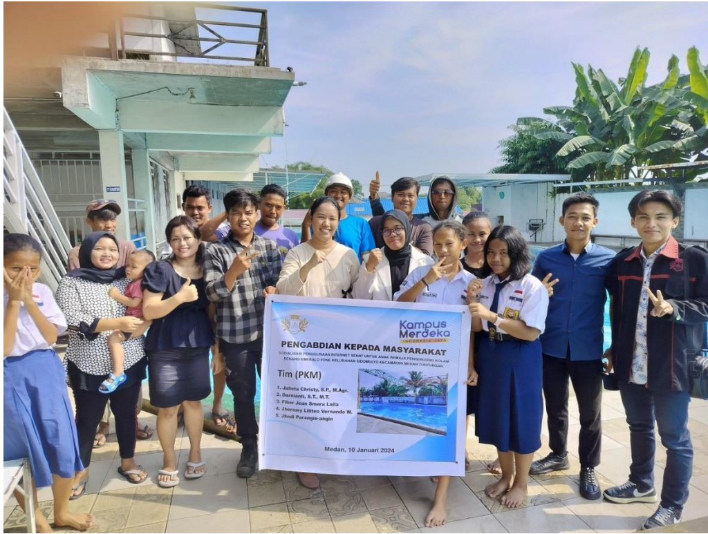
Gambar 5. Dokumentasi sosialisasi internet sehat bersama mitra pengunjung di kolam renang Emerald #One