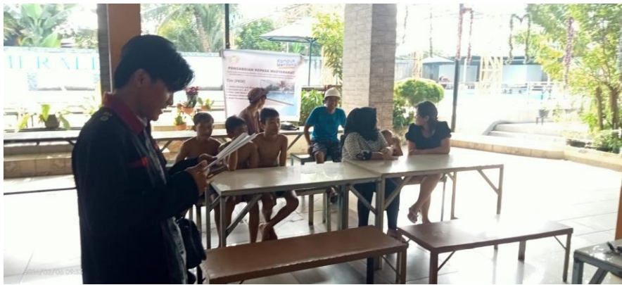
Gambar 4. Sosialisasi mahasiswa untuk pembuatan seperti Faceebook/ Fb, Whatsaap/ Wa, BBM, Intstagram, Youtube

Sosialisasi penggunaan bagian Adanya sosial media memang sangatlah penting untuk membantu kita dalam berhubungan dengan orang lain, baik teman maupun saudara. Namun di dalam kemudahan itu juga terdapat dampak positif serta negatifnya, berikut akan dijelaskan dampak yang terjadi dalam penggunaan media sosial. Dapat dilihat pada gambar ini