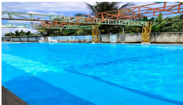
Gambar 1.1 Kolam Renang Emerald #One, Sidomulyo, Medan Tuntungan