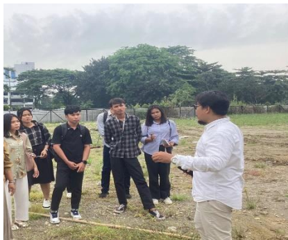
Gambar 1. Sosialisasi Cara Kerja Kolam Retensi USU

Tantangan dan Pertimbangan Efektivitas kolam retensi ini dirancang untuk mengurangi banjir, efektivitasnya dalam jangka panjang masih perlu dievaluasi berdasarkan kondisi cuaca dan perubahan lingkungan. Pemeliharaan: Memastikan kolam retensi berfungsi optimal memerlukan pemeliharaan rutin dan pengawasan terhadap sedimentasi serta pertumbuhan vegetasi yang dapat mengurangi kapasitas tampung. Partisipasi Masyarakat: Keterlibatan masyarakat dalam menjaga kebersihan dan fungsi kolam retensi sangat penting untuk keberlanjutan proyek ini.