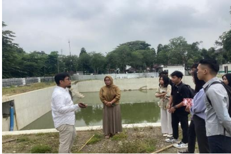
Gambar 2. Cara Kerja Kolam Retensi Saat Hujan