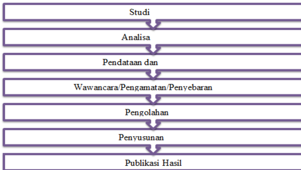
Gambar 1. Diagram Alir Penelitian