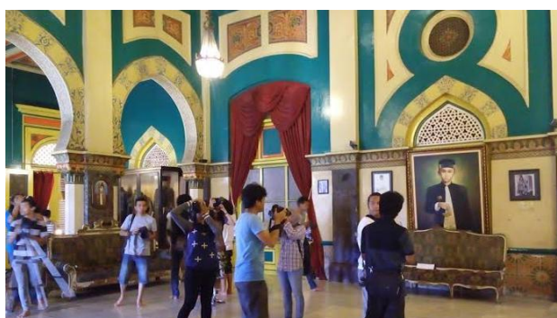
Gambar 2. Kunjungan Masyarakat di Istana Maimun

Berdasarkan gambar tersebut maka Istana Maimun merupakan sarana yang tepat untuk dapat melaksanakan kegiatan Pembinaan Karakter Mahasiswa PGSD Universitas Quality Yang Cinta Tanah Air Dan Berbudaya Melalui Taman Budaya Istana Maimun.