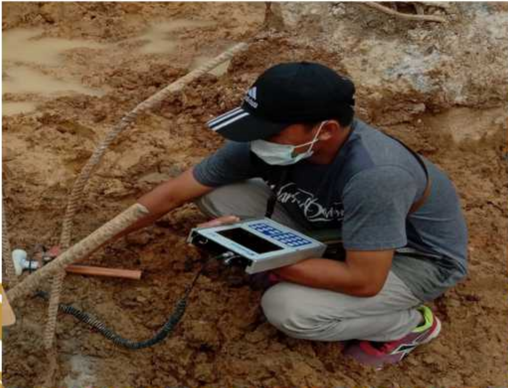
Gambar 4.3 Kondisi Di Lapangan Penelitian