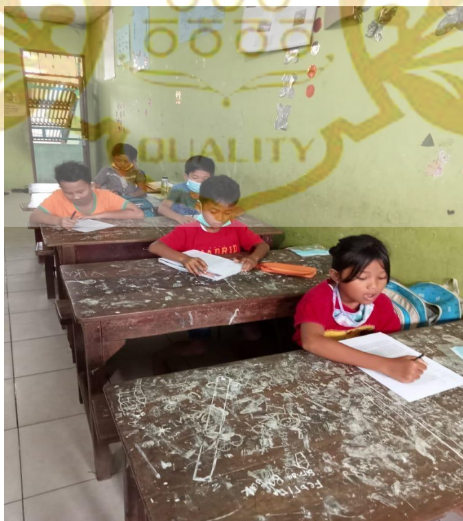
Foto Siswa mengerjakan tes