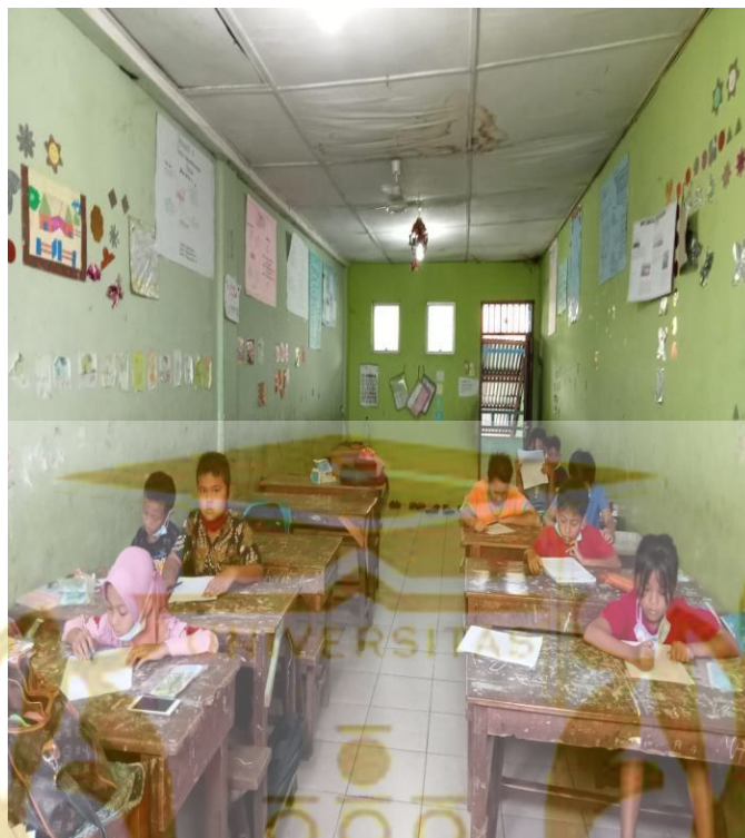
Foto Siswa kelas IV sedang mengerjakan tes