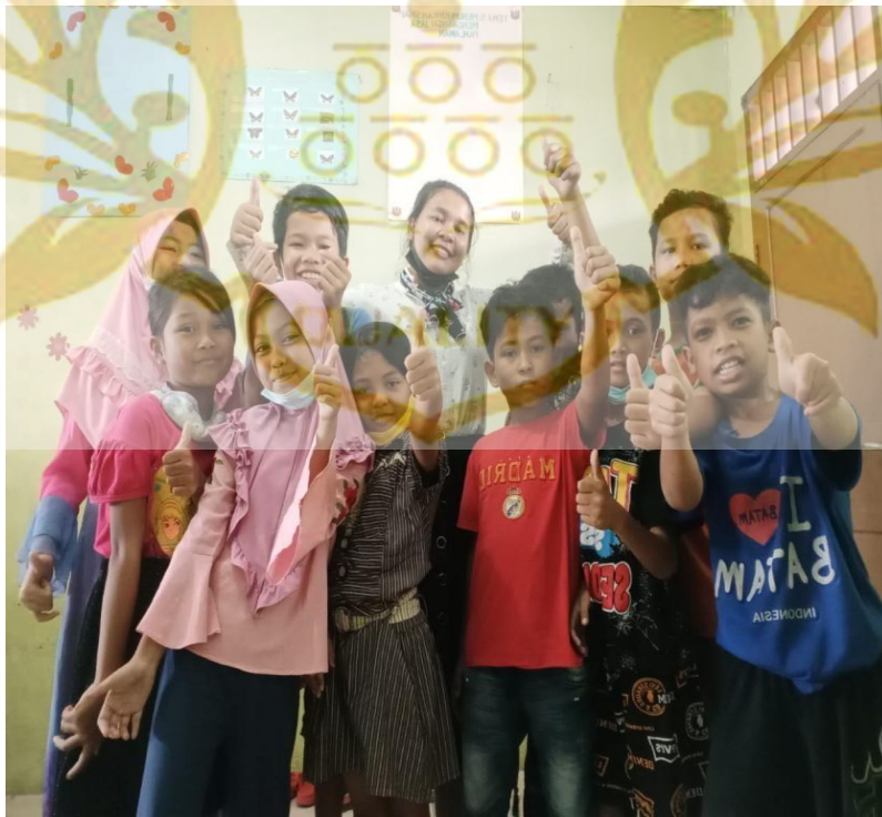
Foto Bersama Siswa kelas IV