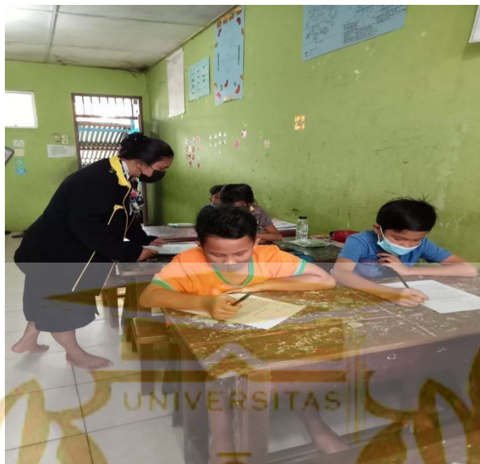
Foto Mengawas latihan tes