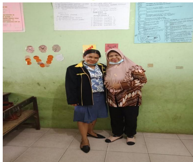
Foro Bersama Wali kelas