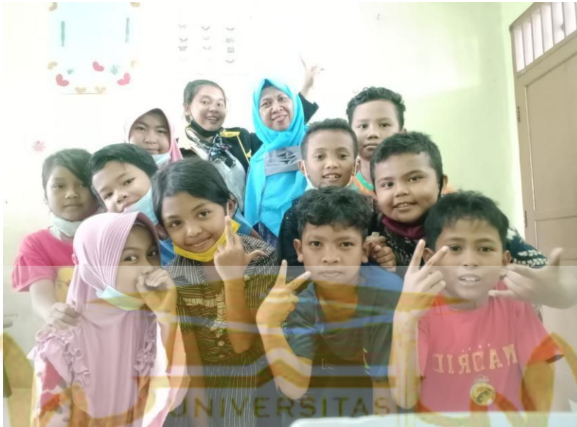
Foto Bersama Siswa kelas IV