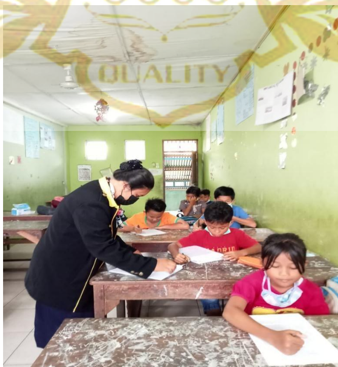
Foto Mengawas latihan tes siswa