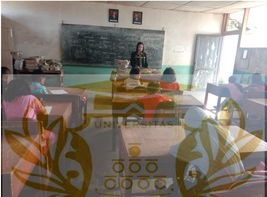
Foto siswa saat mengerjakan soal tes