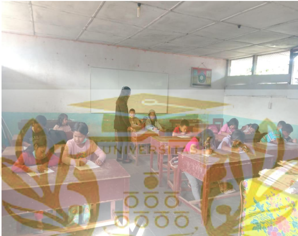
Foto Peneliti melakukan wawancara