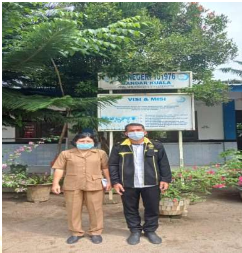
Foto Bersama Wali Kelas IV SD 101976 Bandar Kuala