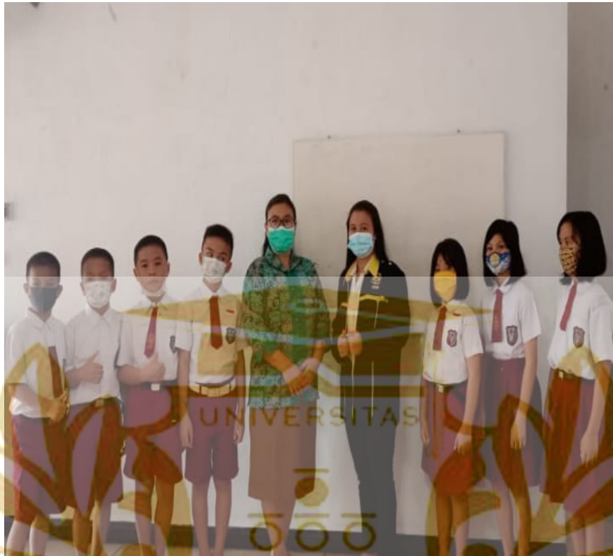
Foto Siswa Di Dalam Kelas