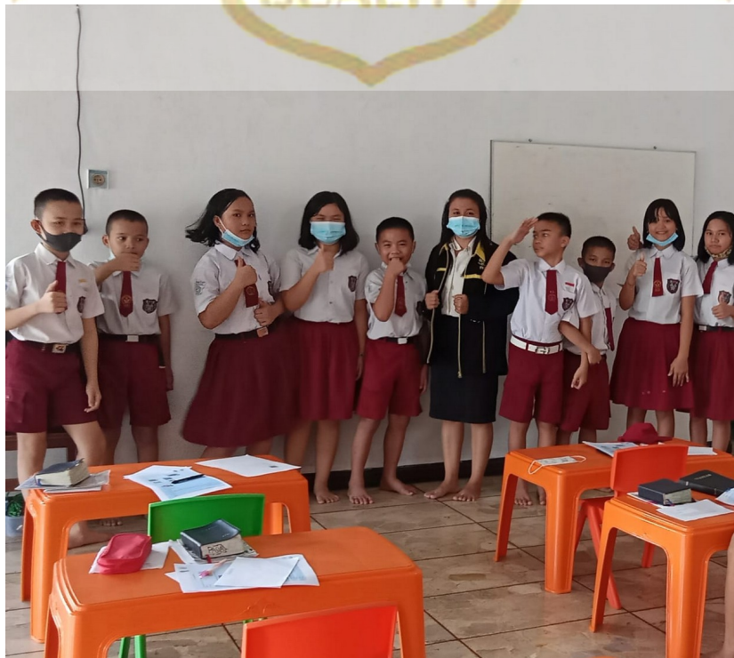
Foto Siswa Di Dalam Kelas