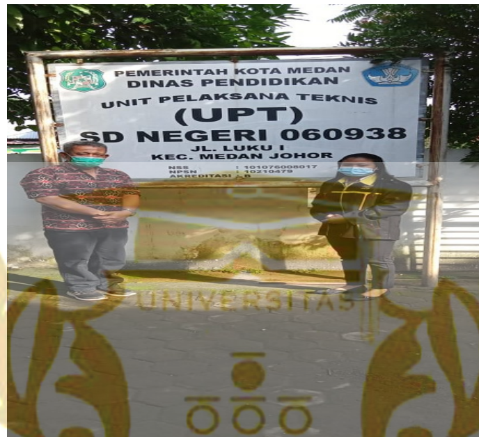
Foto Bersama Guru