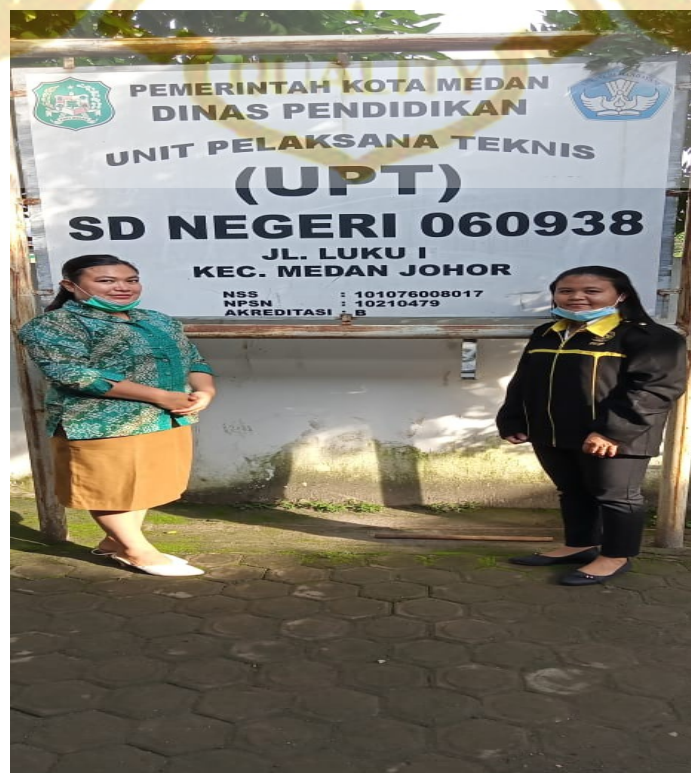
Foto Bersama Guru