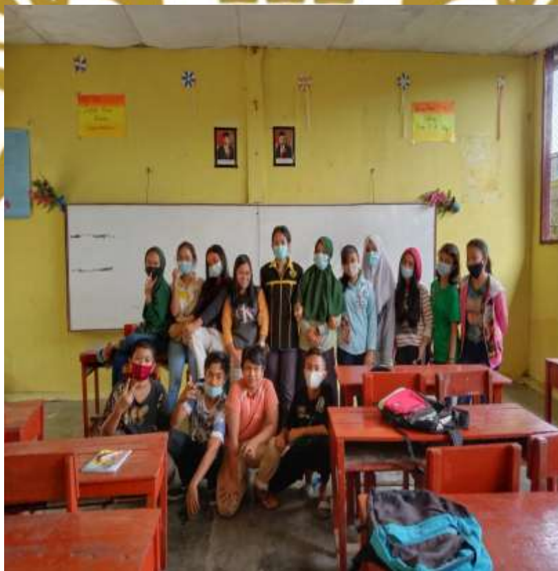
Foto Siswa Di Dalam Kelas