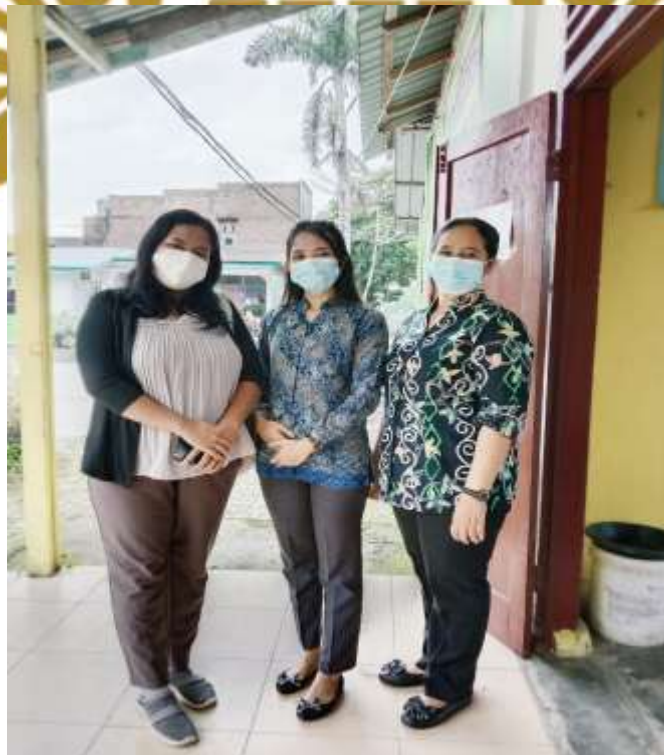
Foto Bersama Guru