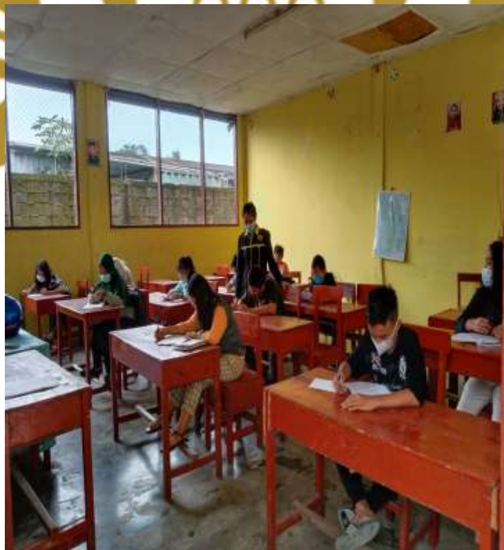
Foto Siswa Mengerjakan Angket