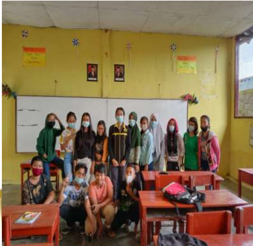
Foto Siswa Di Dalam Kelas