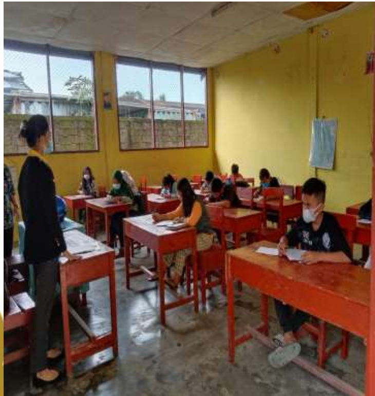
Foto Pemberian Angket Kepada Siswa