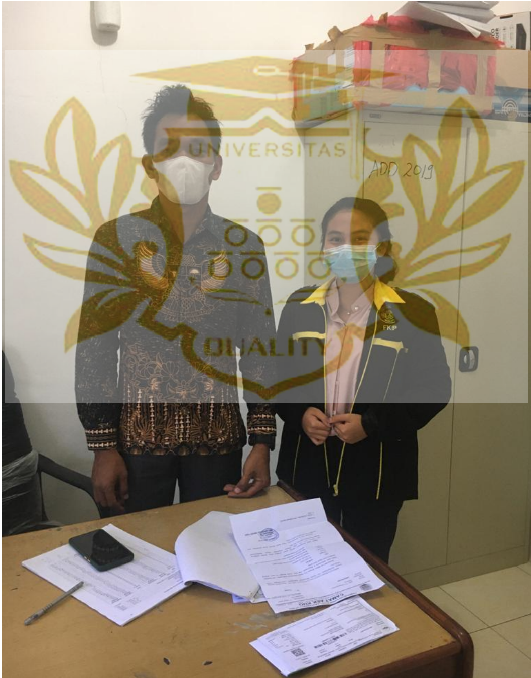
Bersama Dengan Kepala Desa