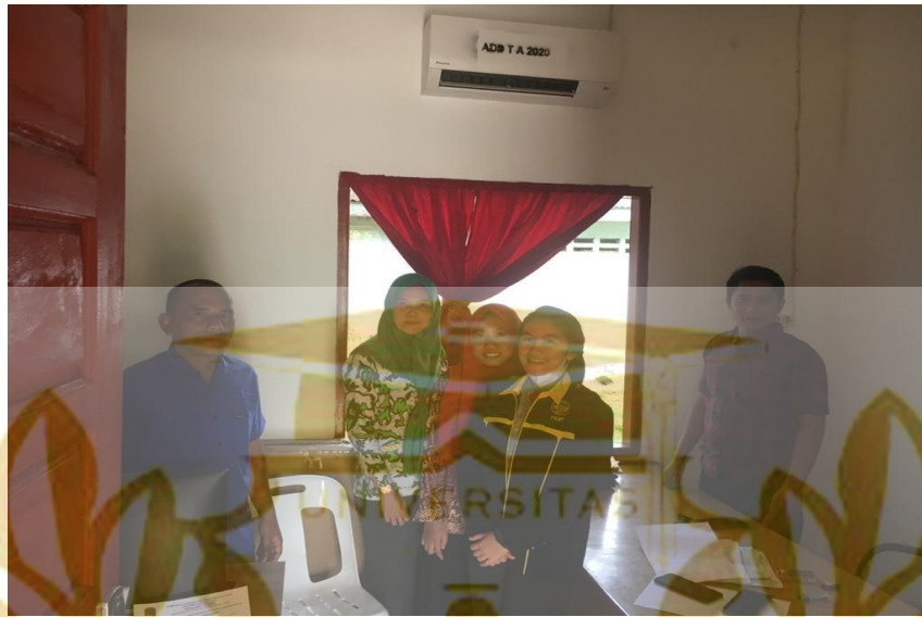
Bersama Dengan Perangkat Desa