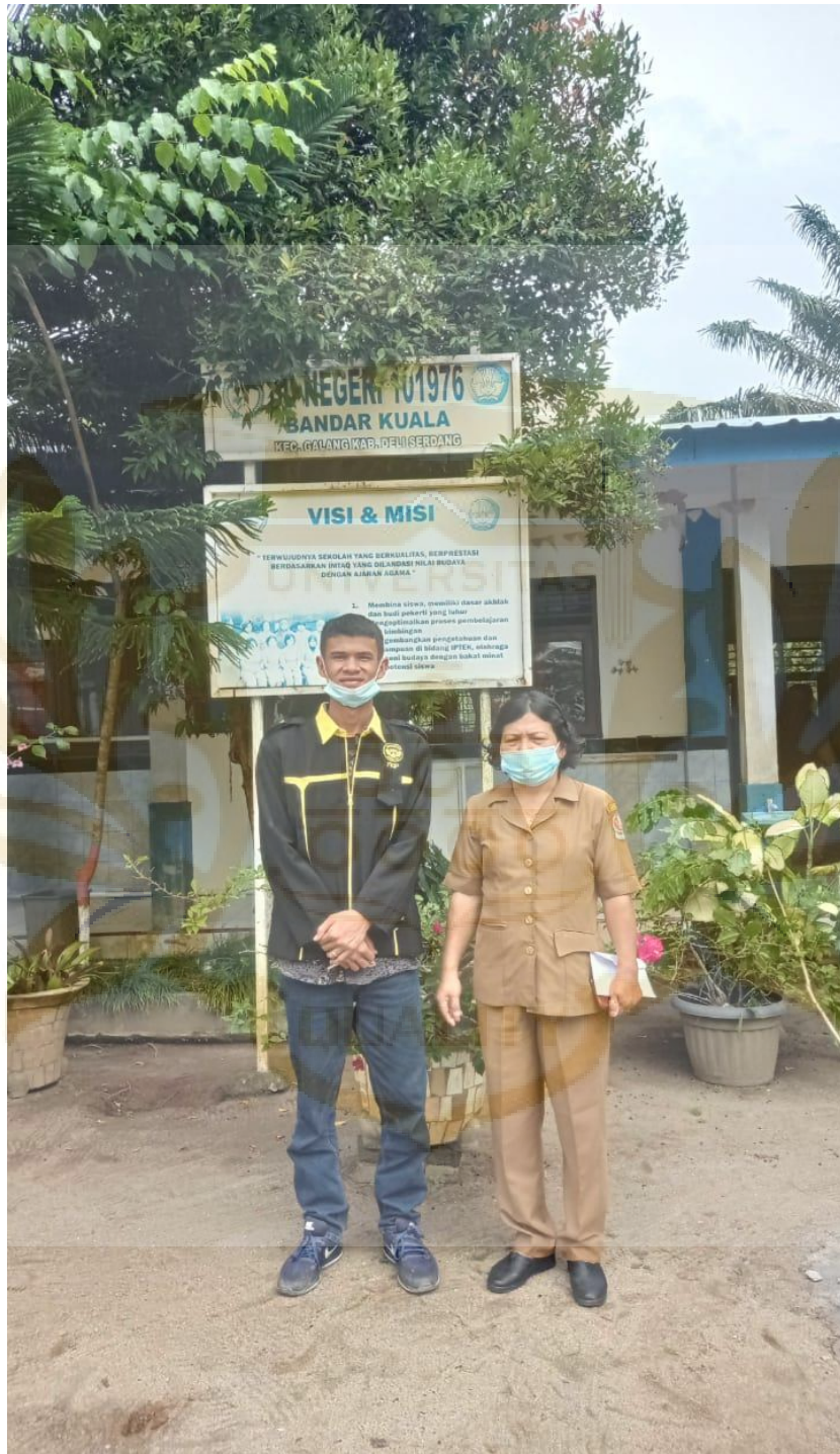
Foto Bersama Kepala Sekolah SD Negeri 101976 Bandar Kuala