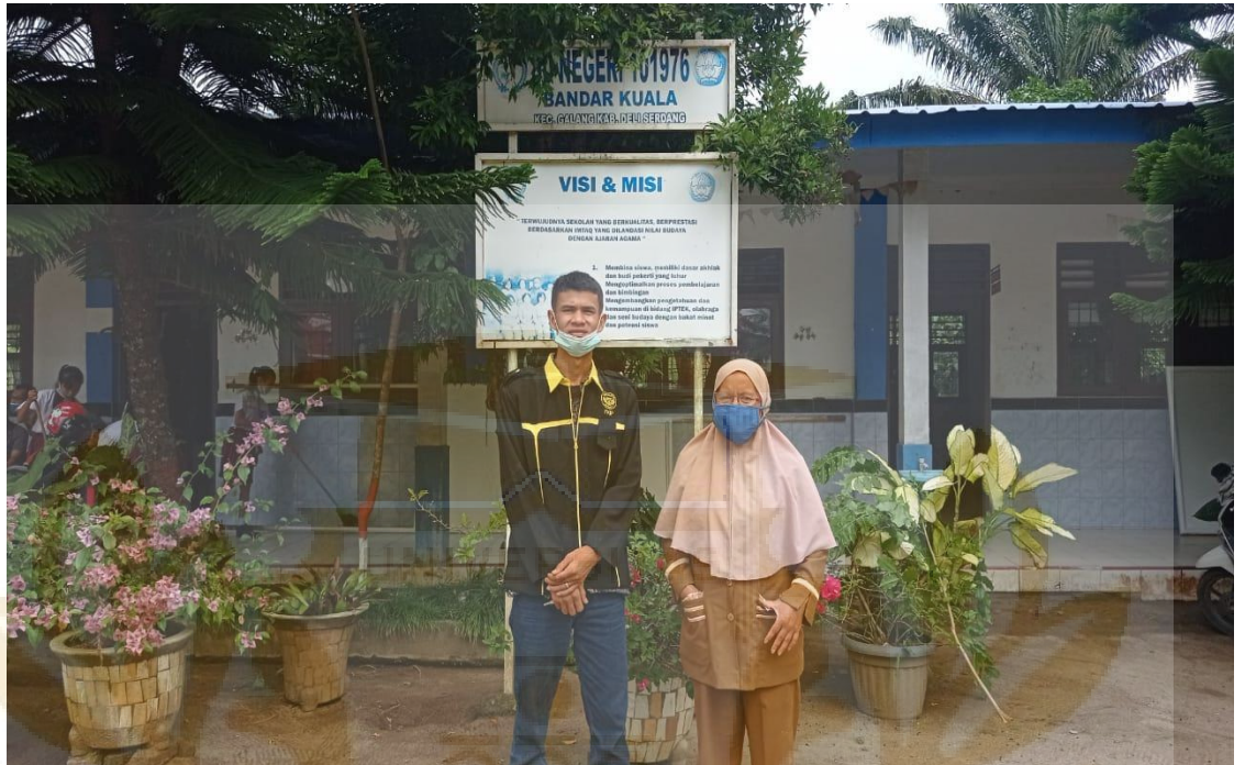
Foto Bersama Siswa Kelas IV SD Negeri 101976 Bandar Kuala