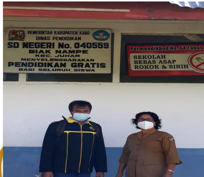
Foto Bersama Guru