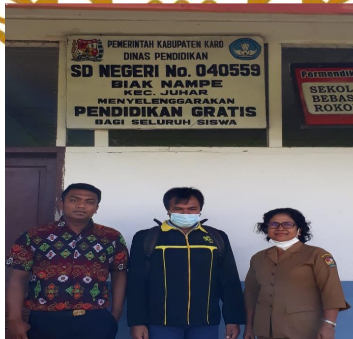
Foto Bersama Guru