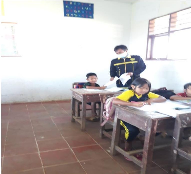
Foto Siswa Di Dalam Kelas