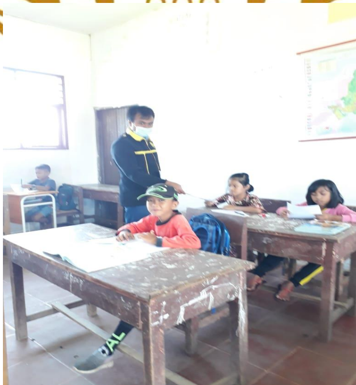
Foto Siswa Di Dalam Kelas