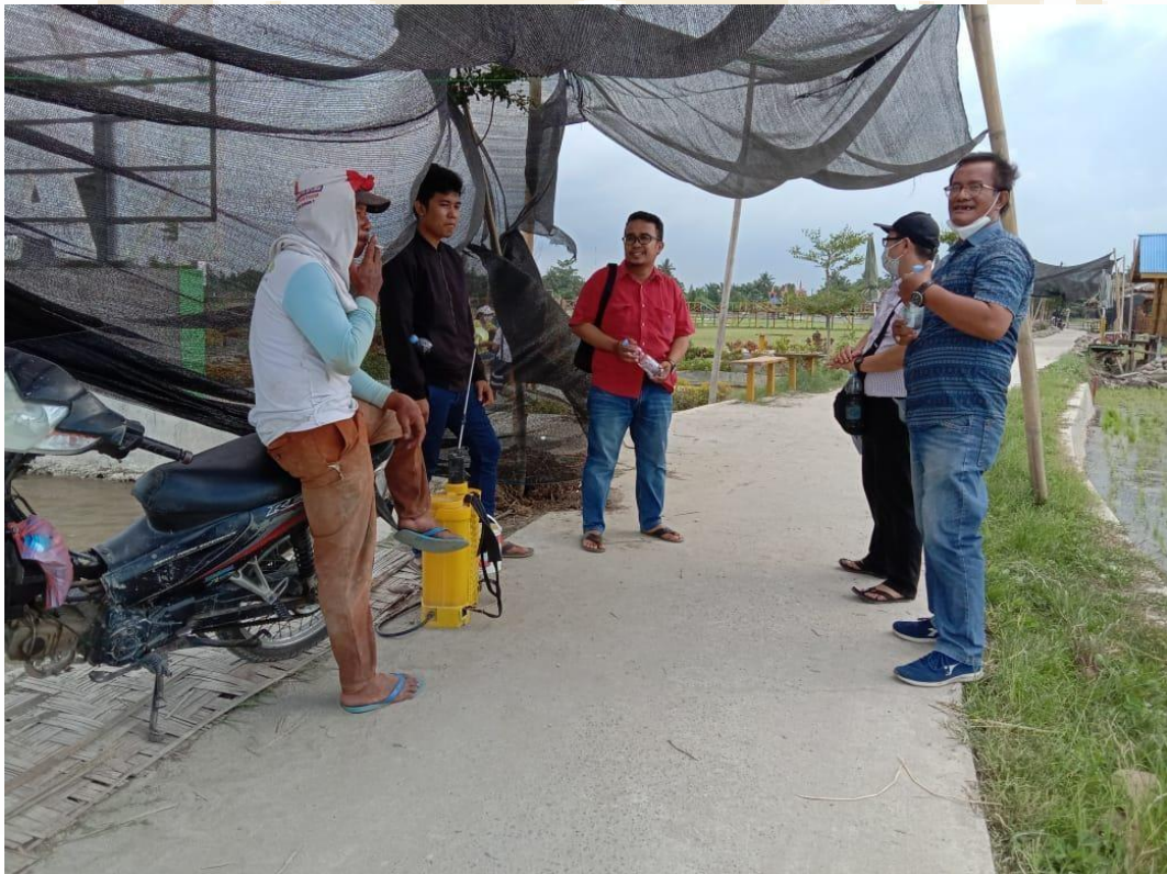
Lampiran.13 Lokasi Penelitian