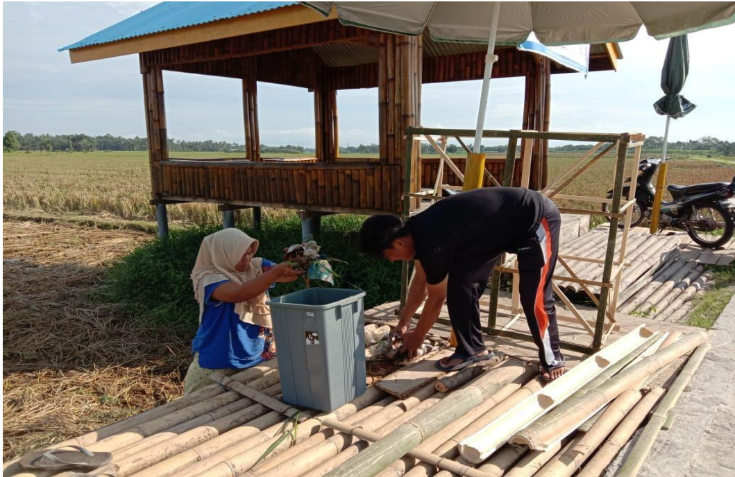
Lampiran.15 Penjual Koin