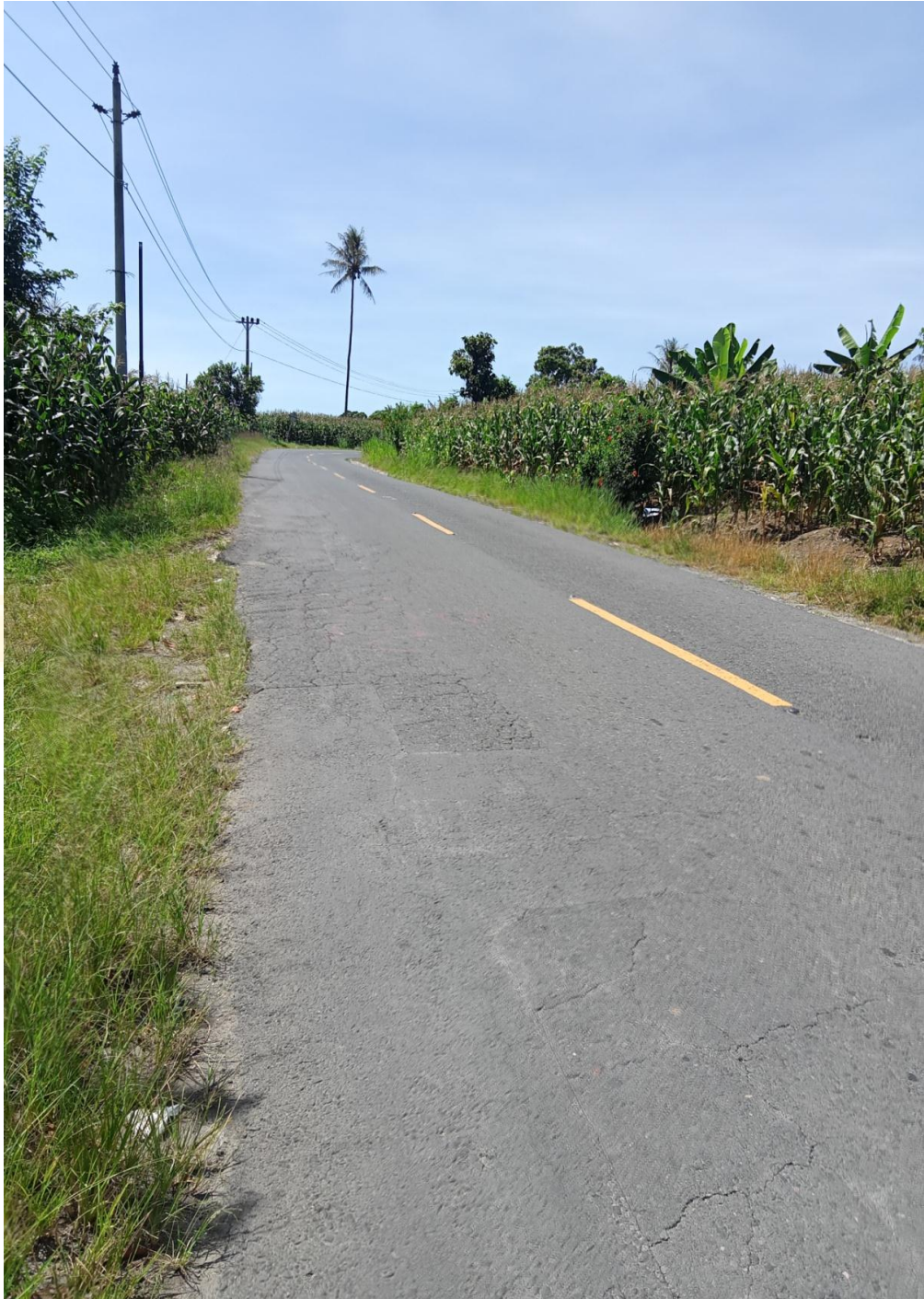
JALAN KOTACANE- KABANJAHE