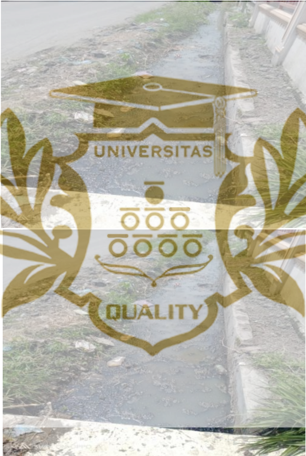
Gambar 14. Drainase Yang Dipenuhi Air Kotor