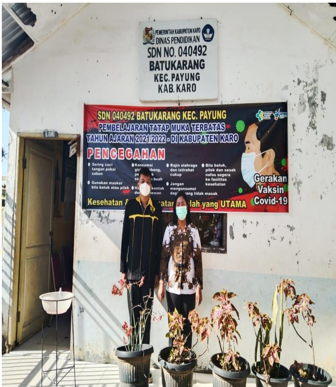
Foto Dengan Kepala Sekolah