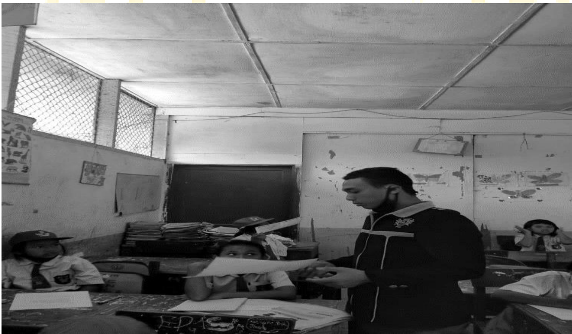
Foto pengumpulan soal lembar jawaban siswa