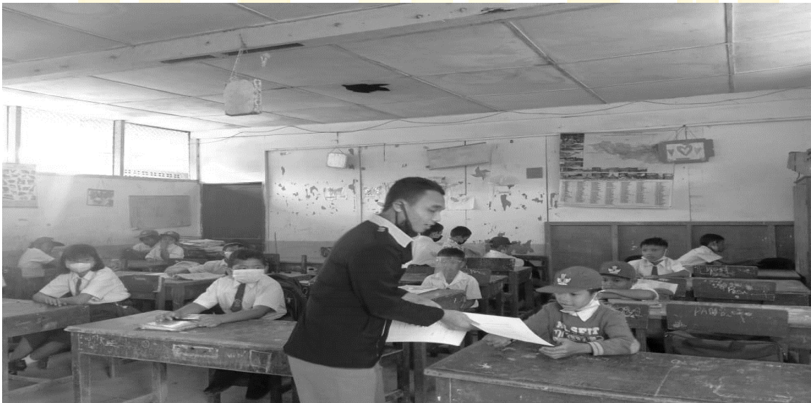
Foto pembagian soal tes kepada siswa