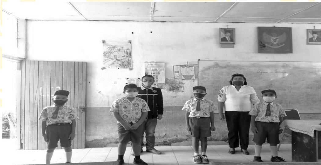
Foto bersama guru wali kelas IV dan Siswa Laki-Laki SD negeri 040492 Batukarang