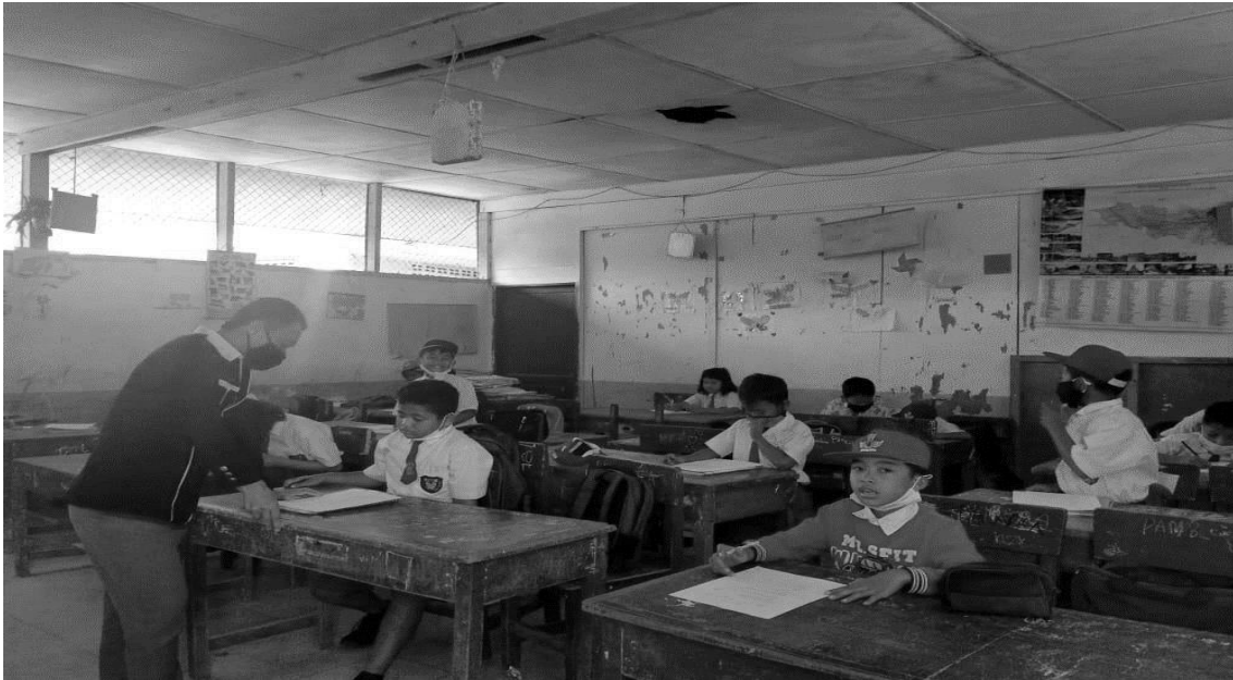
Foto siswa mengerjakan soal tes