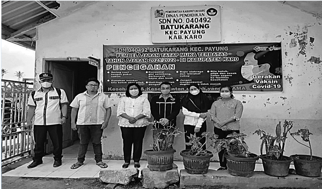
Foto bersama kepala sekolah dan guru SD Negeri 040492 Batukarang Kec. Payung