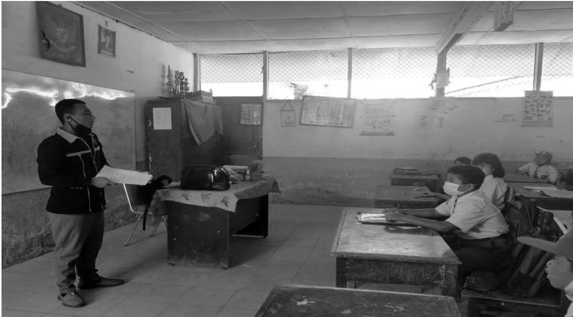
Foto memberikan arahan cara menyelesaikan soal tes