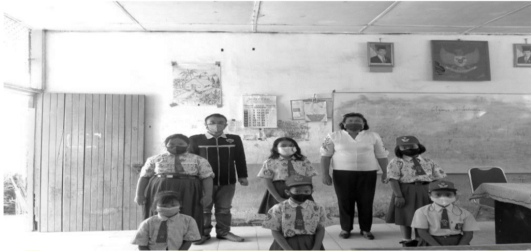
Foto bersama guru wali kelas IV dan Siswa Perempuan SD negeri 040492 Batukarang