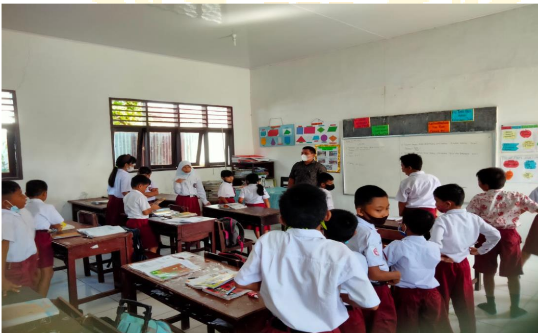
(Dokumentasi Pada saat Observasi kegiatan Pembelajaran)