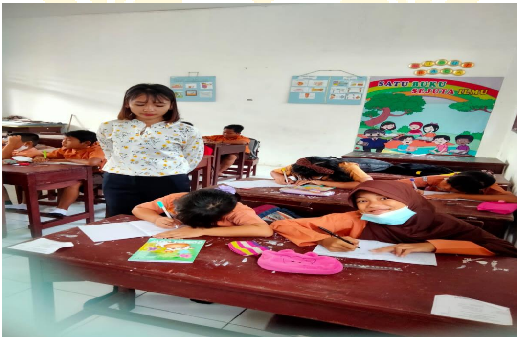
(Dokumentasi pada saat Observasi)