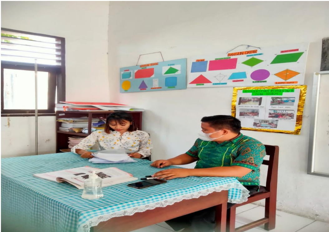
(Dokumentasi Wawancara salah satu guru)