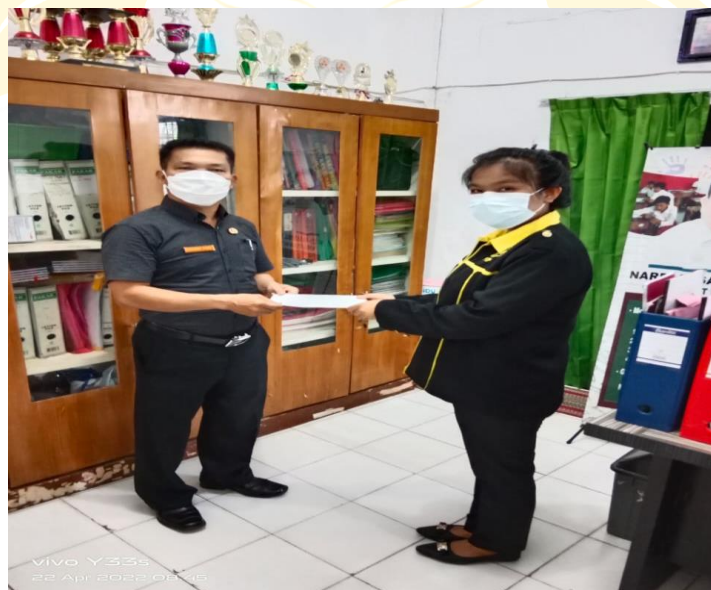
Foto bersama Kepala Sekolah SD Negeri 064023 Kemenangan Tani