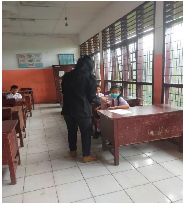
Mewawancarai Siswa yang Berkesulitan menjawab soal Tes