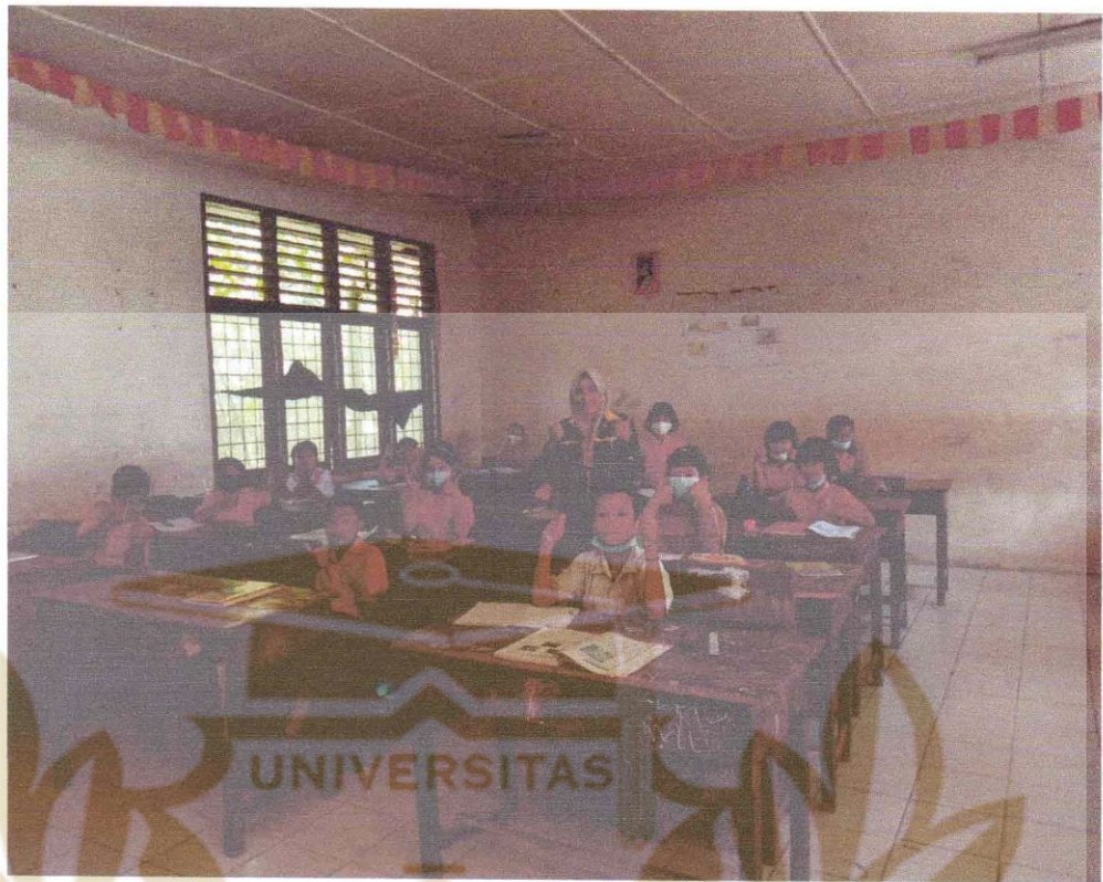
Foto bersama wali kelas