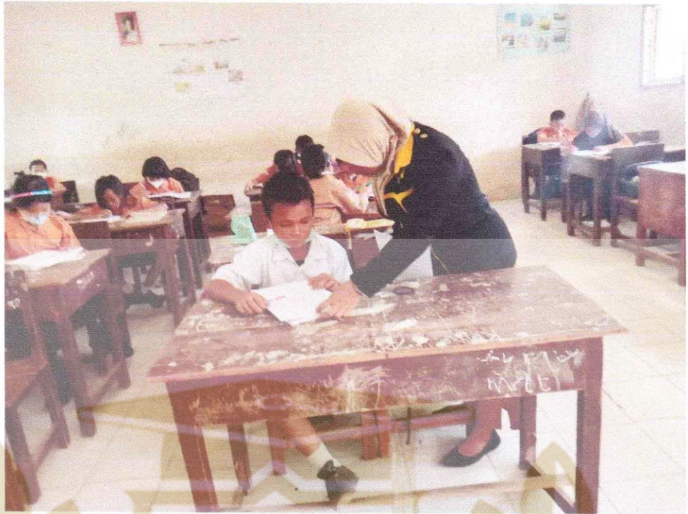
Penelitian menjelaskan cara mengisi angket