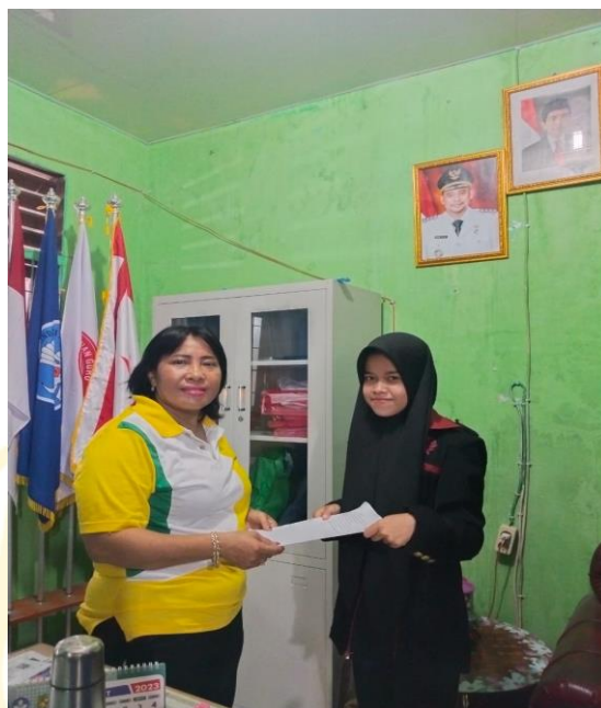
Foto bersama Kepala Sekolah