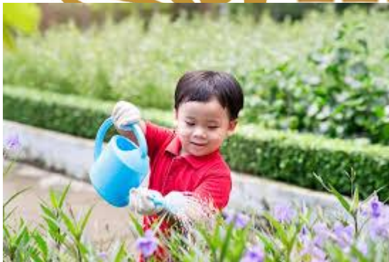
Gambar 2.6 Kebersihan di lingkungan masyarakat