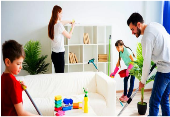
Gambar 2.4 Kebersihan bersama keluarga