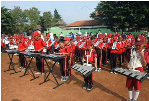
Gambar 2.5 Bermain alat musik