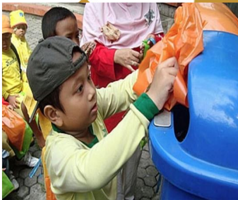
Gambar 2.2 Membuang sampah pada tempatnya