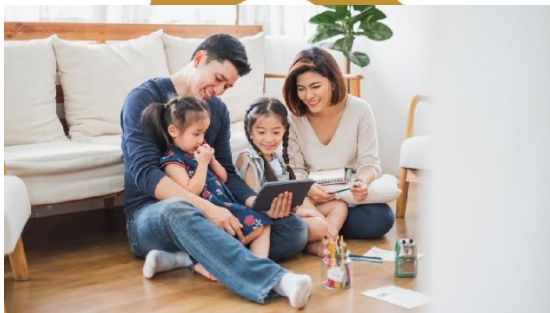
Gambar 2.3 Kebersamaan dengan keluarga