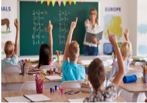
Gambar 2.1 Belajar di kelas