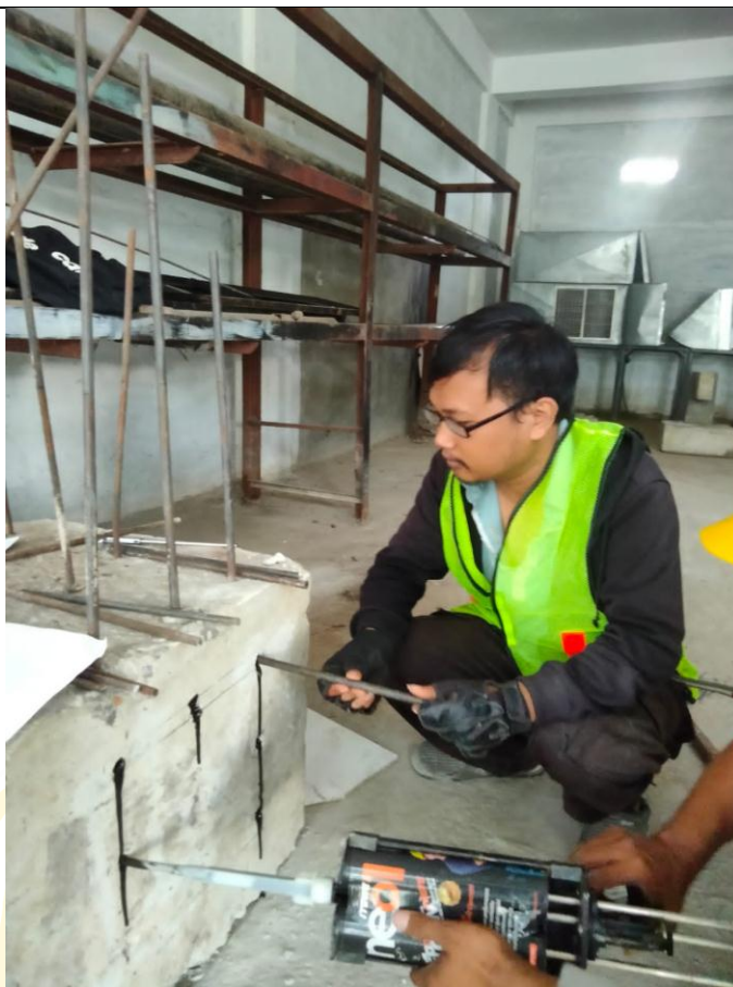
Gambar penanaman tulangan