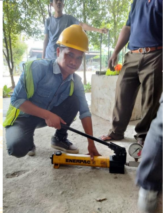
Pemompanan alat uji hidrolik untuk memberi beban tarik