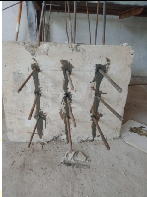
Gambar benda uji beton tulangan polos sebelum diuji tarik