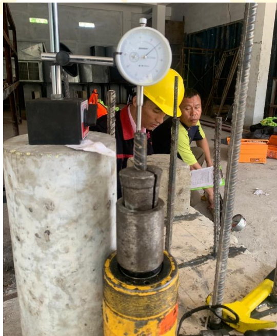
Gambar tampak skala indikator