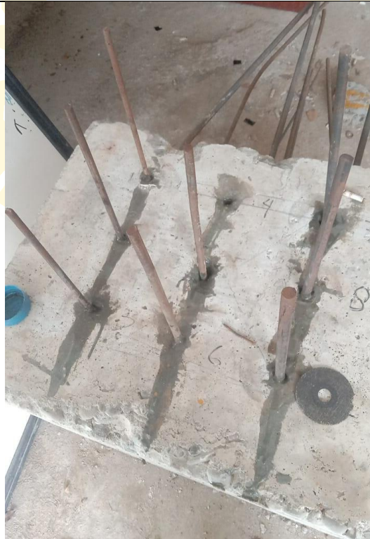
Gambar benda uji beton tulangan polos setelah diuji tarik