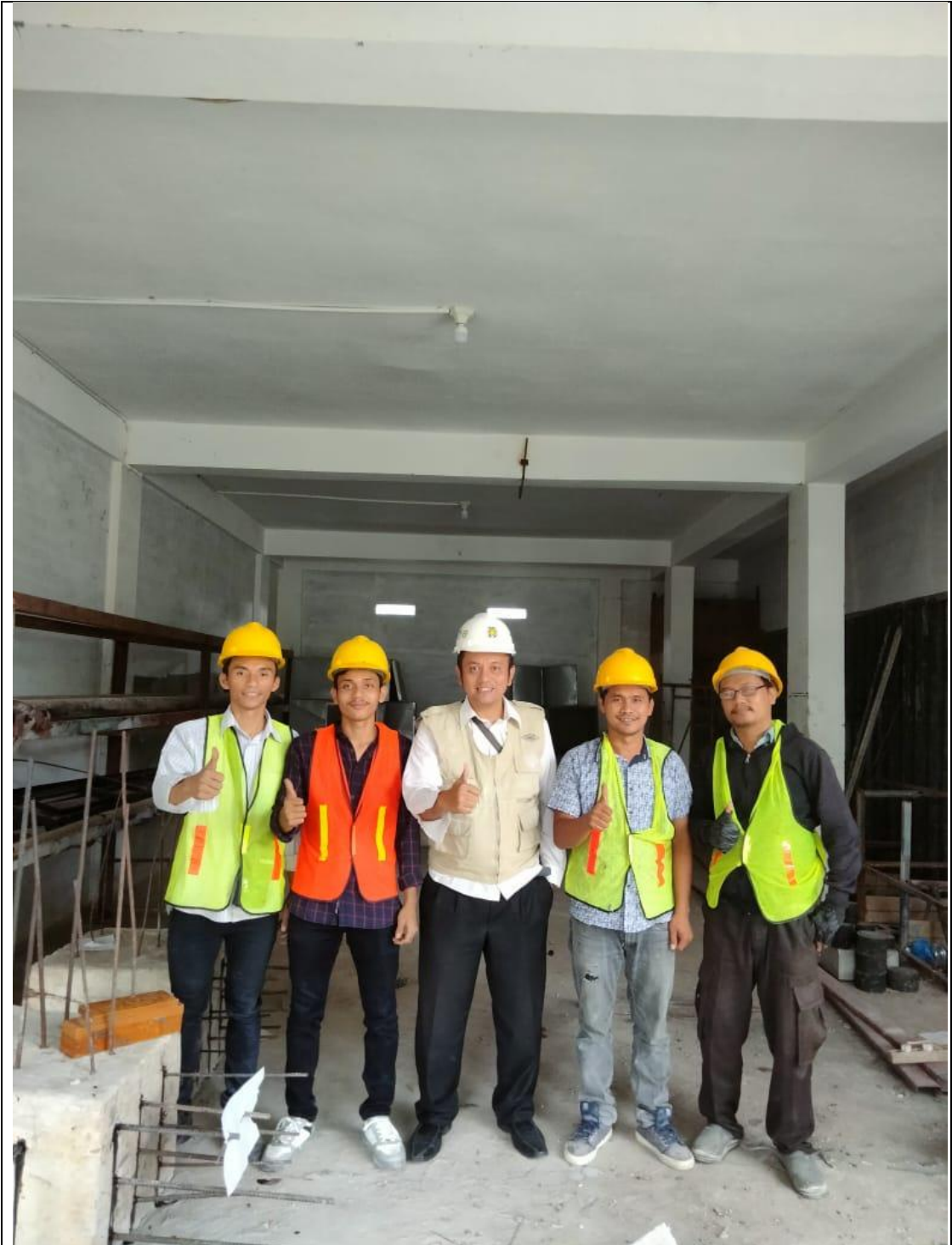
Foto Bersama Dosen Terbaik di Laboratorium