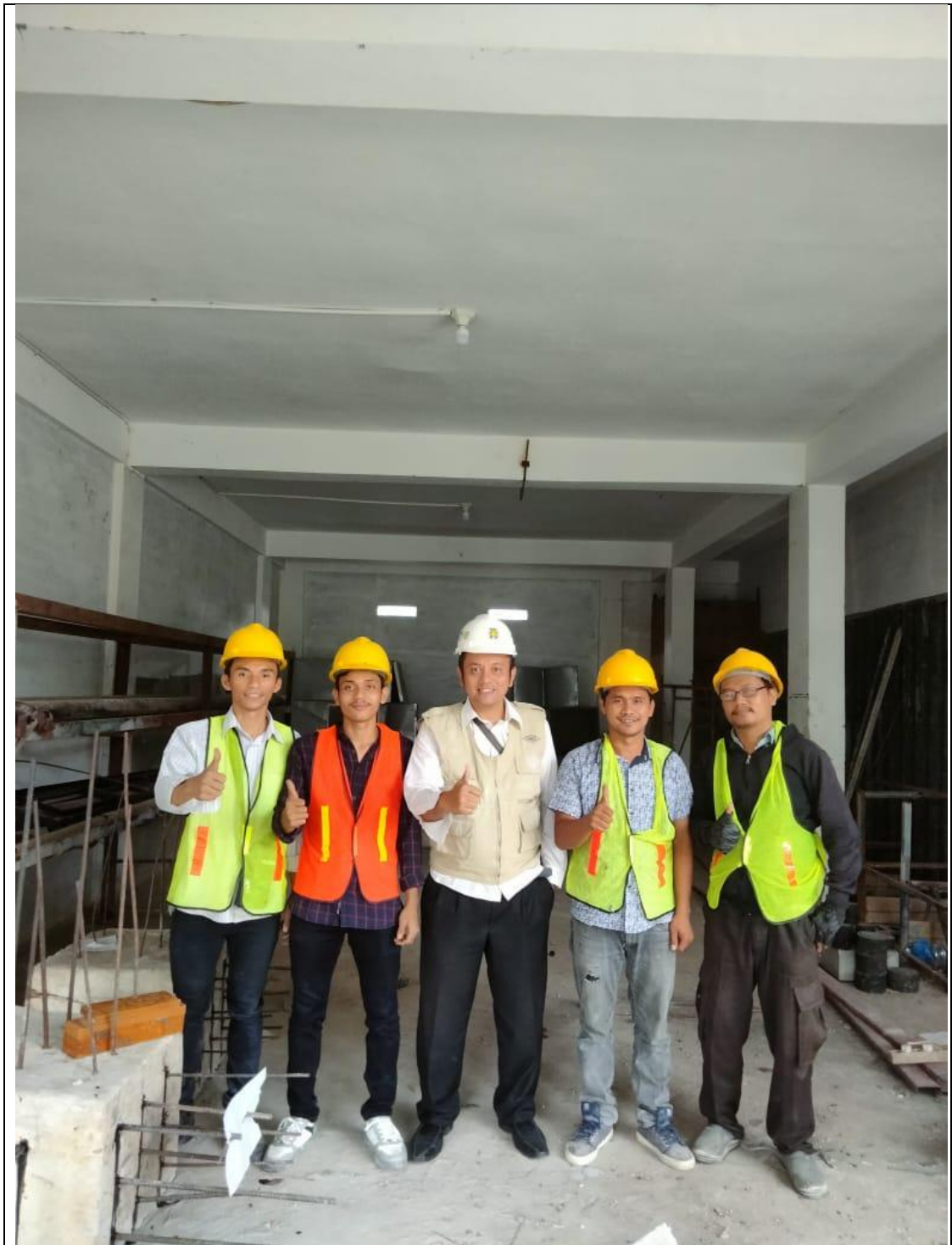
Foto Bersama Dosen Terbaik di Laboratorium