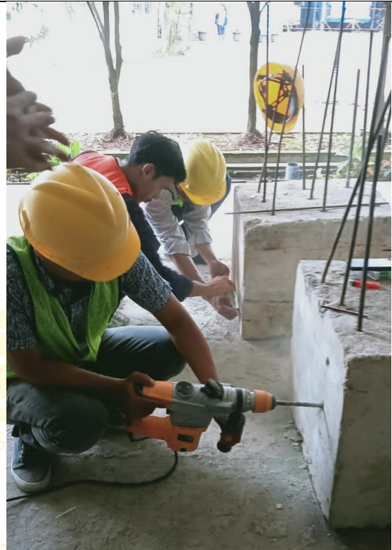
Gambar pengeboran dengan mesin bor