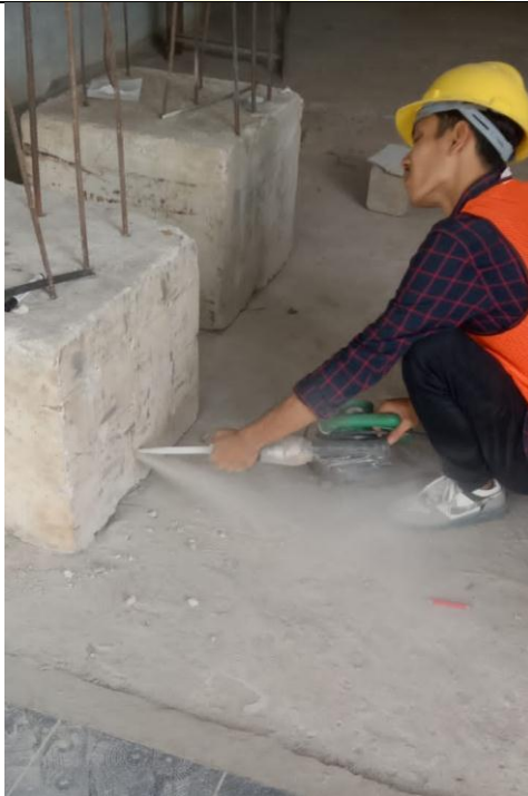
Gambar pembersihan lobang pada beton dengan alat mesin blower