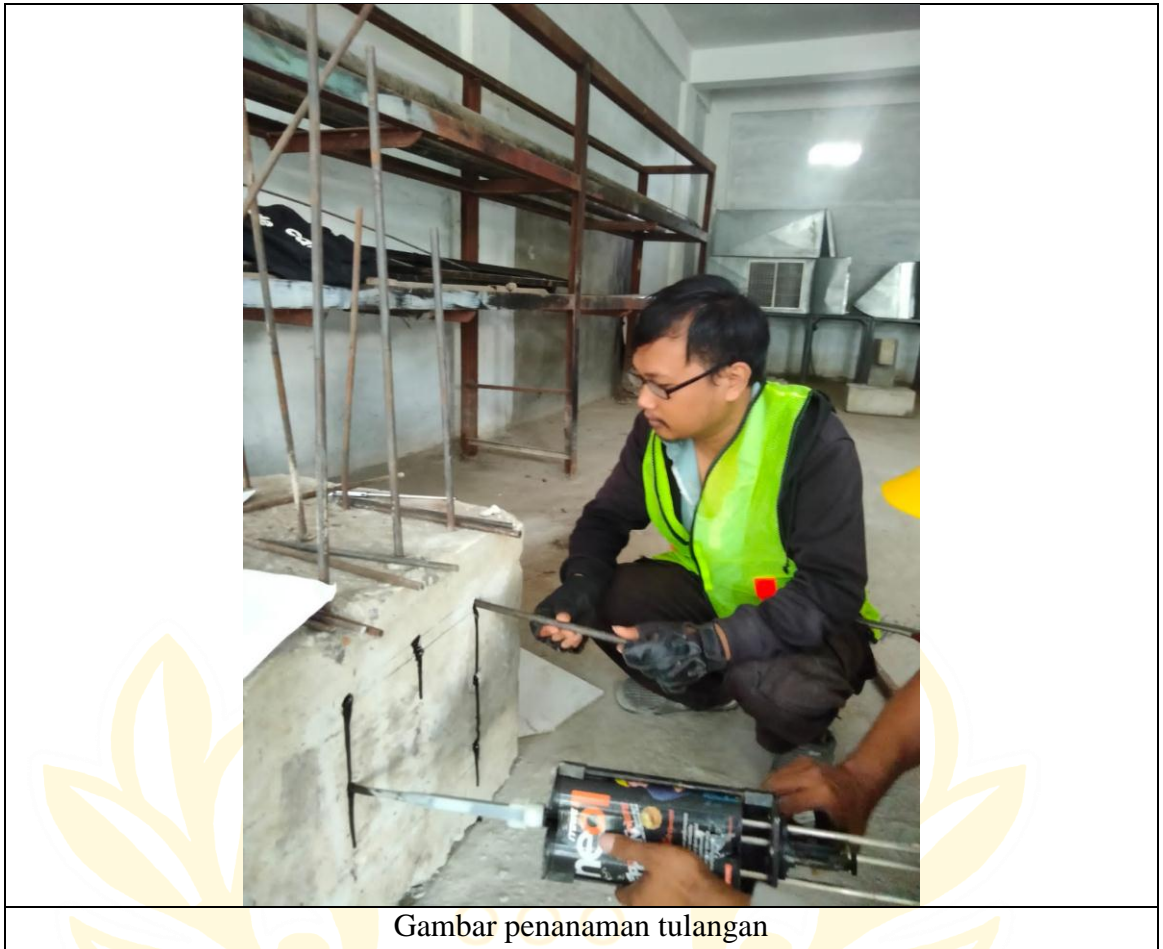
Gambar penanaman tulangan