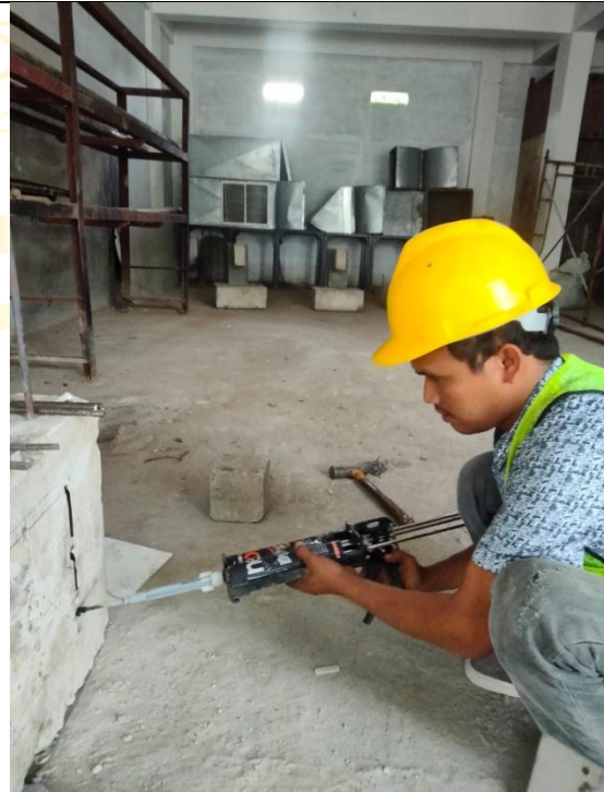
Gambar penyuntikkan Chemical epoxy kedalam lobang dengan alat chemical injection