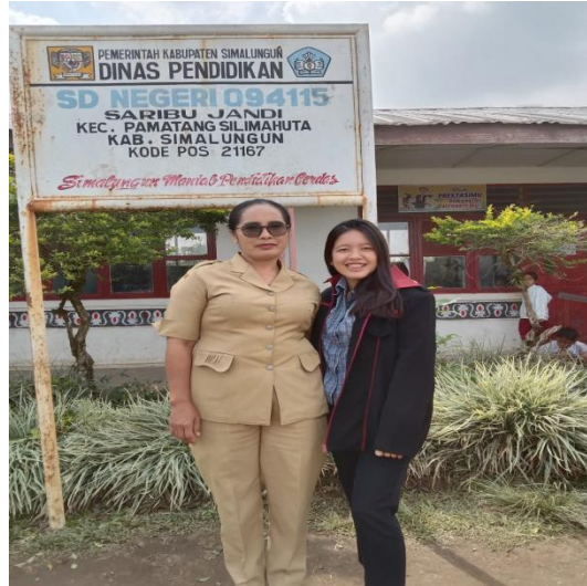
7. Foto bersama Guru-guru SD Negeri 094115 Saribu Jandi