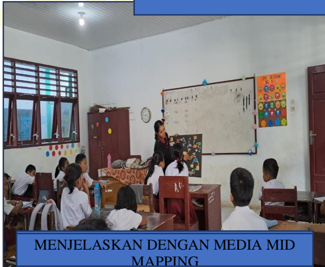
MENJELASKAN DENGAN MEDIA MID MAPPING