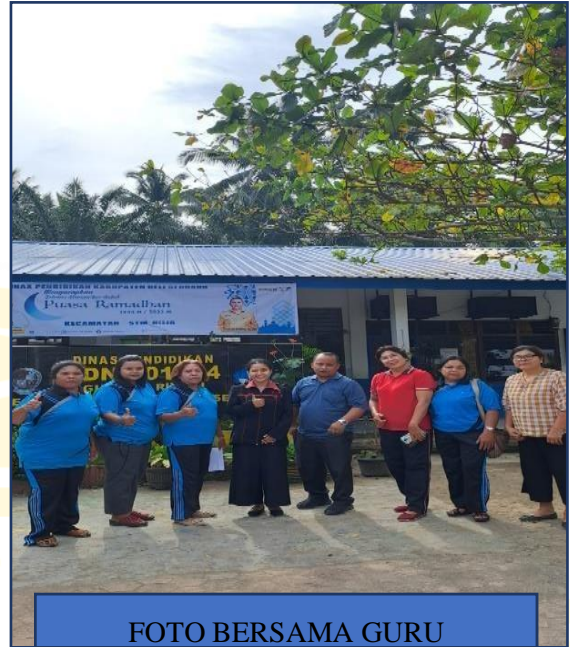
FOTO BERSAMA GURU