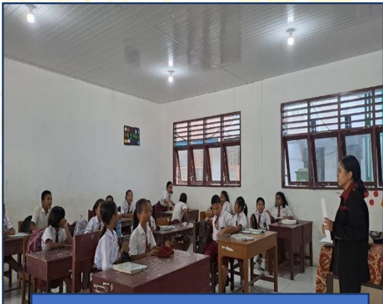
MENJELASKAN Pengerjaan SOAL