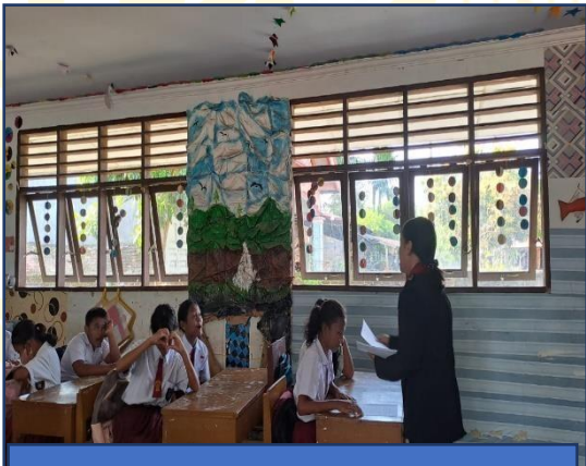
MENJELASKAN Pengerjaan SOAL