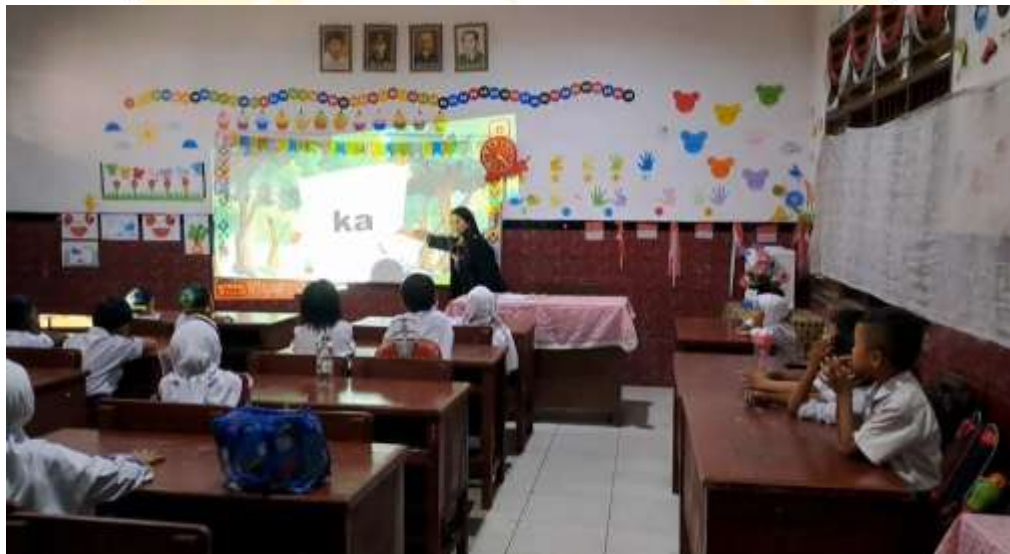
Penggunaan media kartu kata berbasis powerpoint didalam kelas