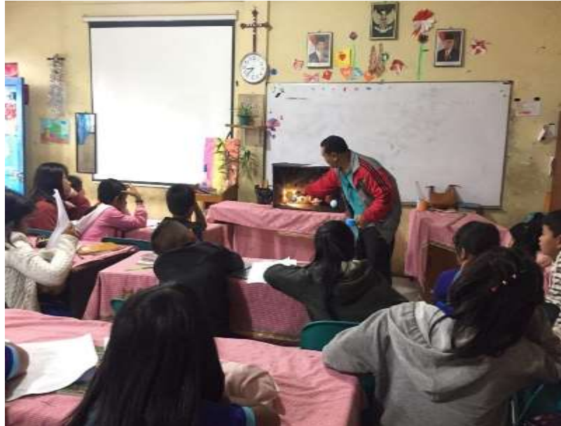
Dokumentasi bersama Guru Kelas dan Peserta Didik