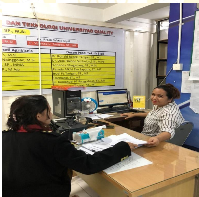
Wawancara Dengan Bagian Administrasi Fakultas Sains dan Teknologi