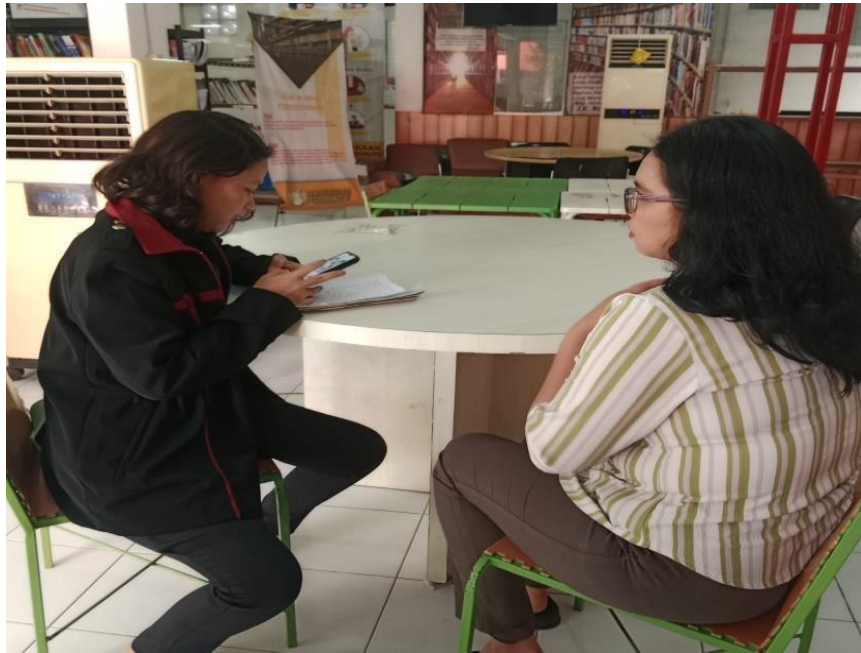
Wawancara Dengan Bagian Perpustakaan