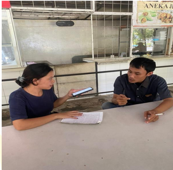
Wawancara Dengan Bagian IT