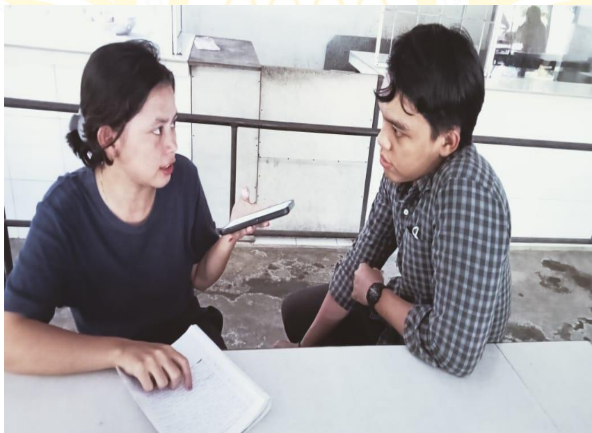
Wawancara Dengan Bagian IT