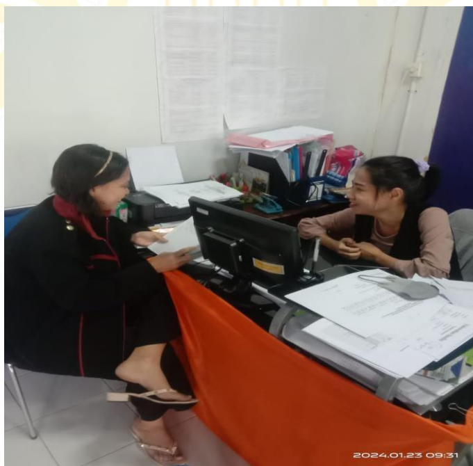
Wawancara Dengan Bagian Administrasi Fakultas Sosial Dan Hukum