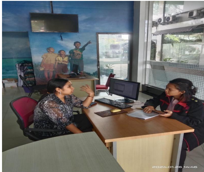
Wawancara Dengan Bagian Informasi