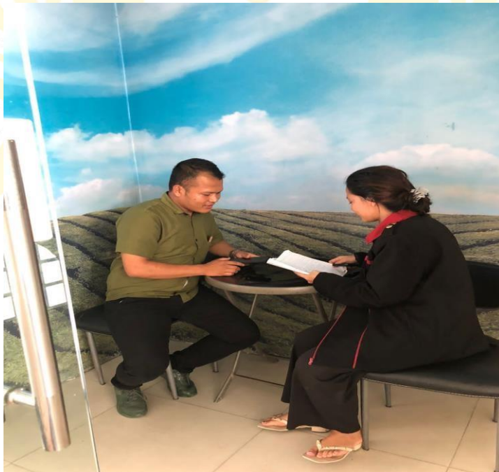
Wawancara Dengan Bagian Kemahasiswaan