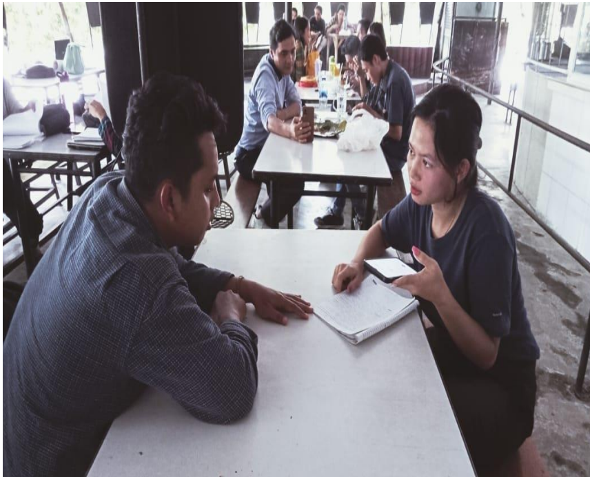
Wawancara Dengan Bagian IT