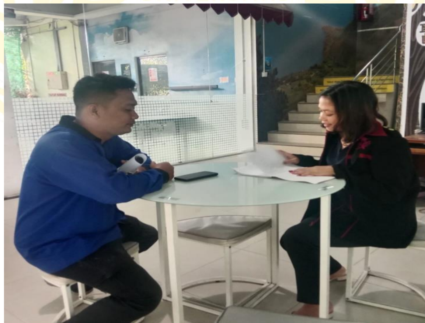
Wawancara Dengan Bagian IT