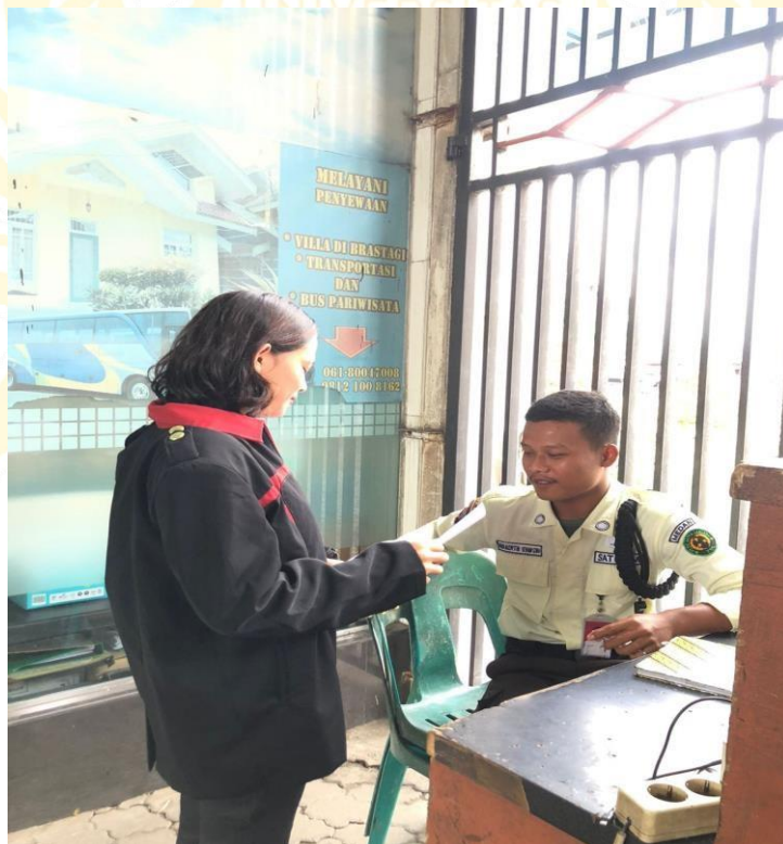
Wawancara Dengan Bagian Keamanan