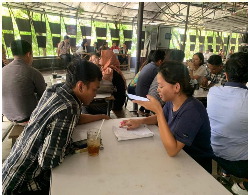
Wawancara Dengan Bagian IT