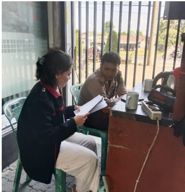
Wawancara Dengan Bagian Keamanan