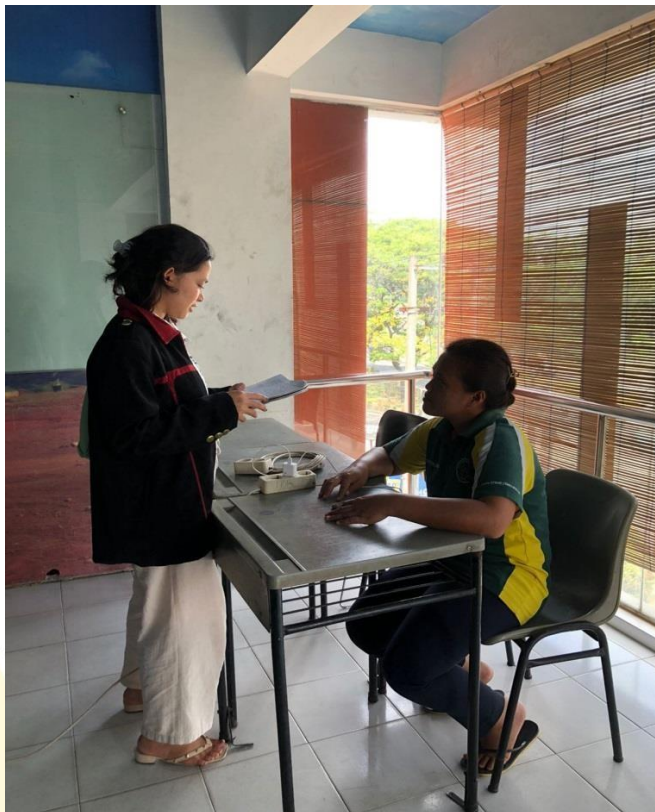
Wawancara Dengan Bagian Kebersihan