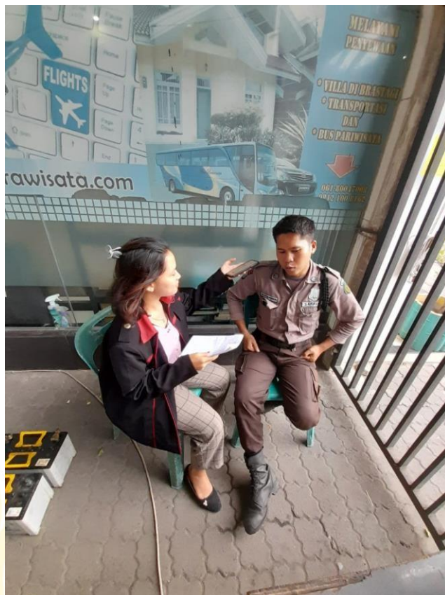
Wawancara Dengan Bagian Keamanan