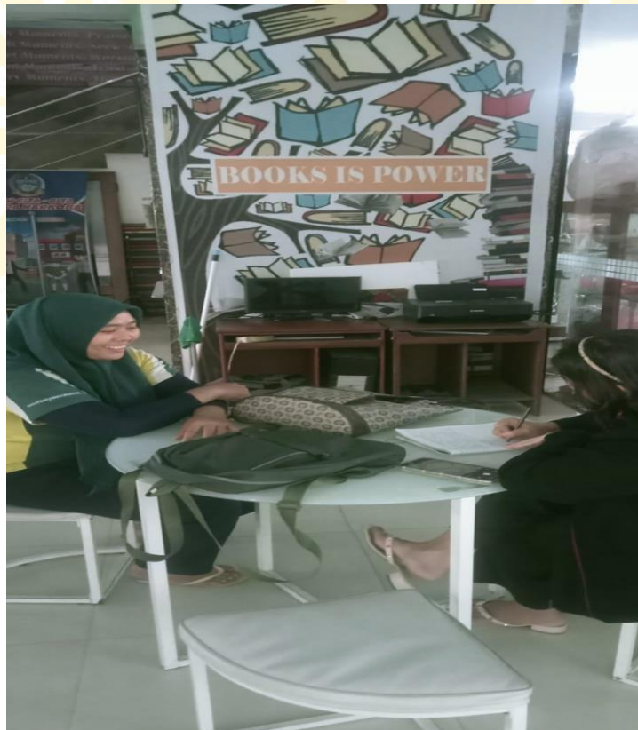
Wawancara Dengan Bagian Kebersihan