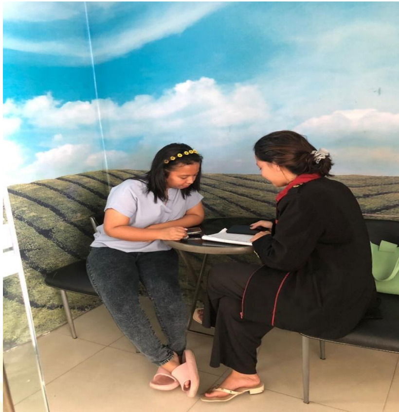
Wawancara Dengan Bagian Keuangan