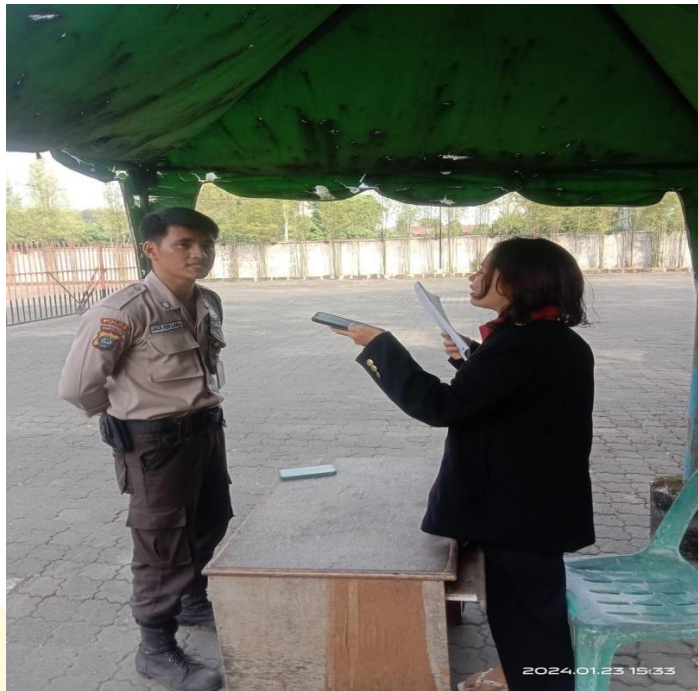
Wawancara Dengan Bagian Keamanan