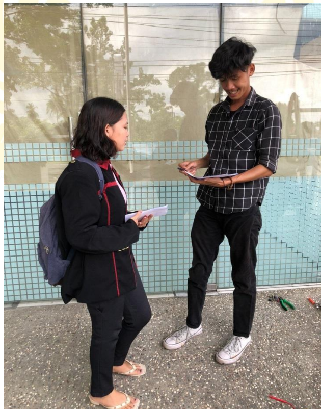
Wawancara Dengan Bagian IT