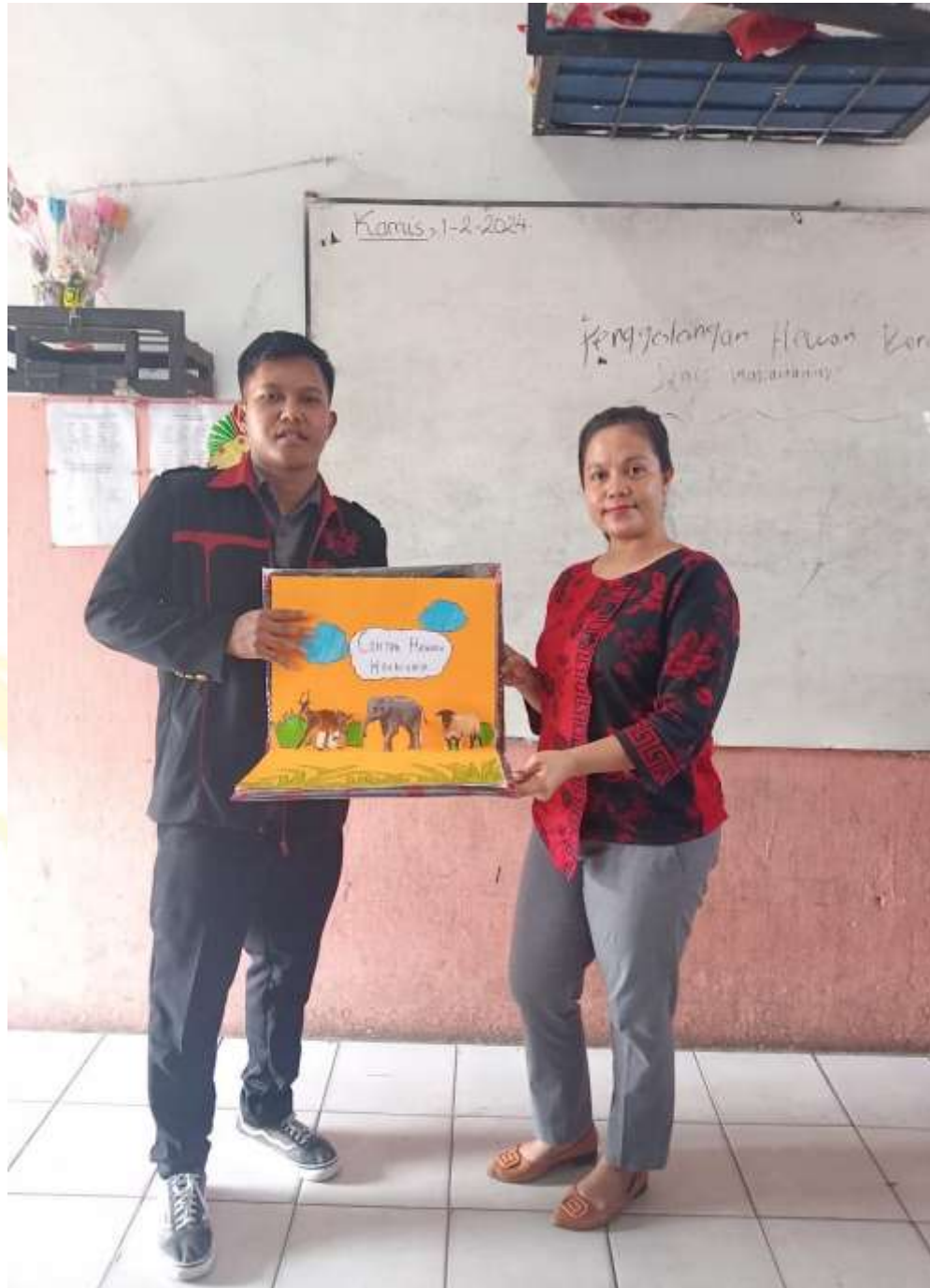
Foto Bersama Guru Kelas Va SDN 064023 Kemenangan Tani