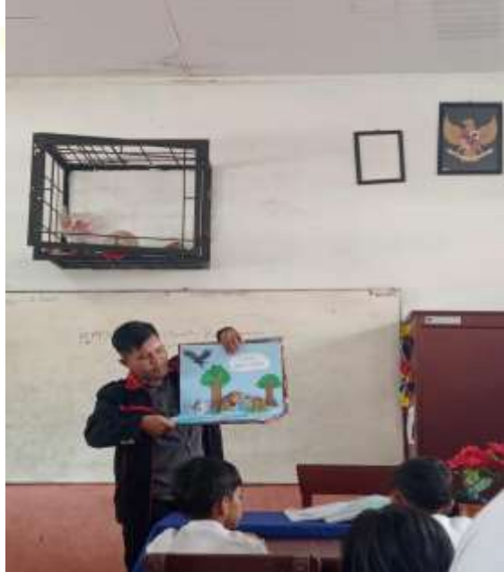
Uji Coba Kelompok Besar