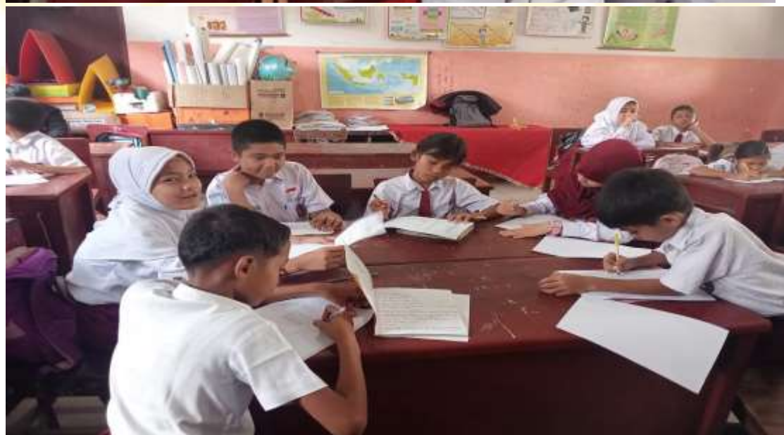
Uji coba kelompok kecil