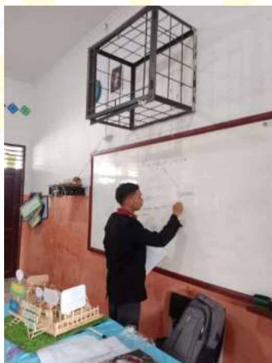
Penyampaian Materi Rangkaian Listrik Berbasis Praktikum