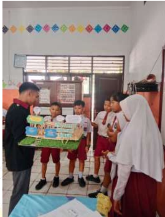
Uji Coba Produk Dengan Skala Likert Kecil Terdiri Dari 3 Siswa Putra dan 3 Siswi Putri