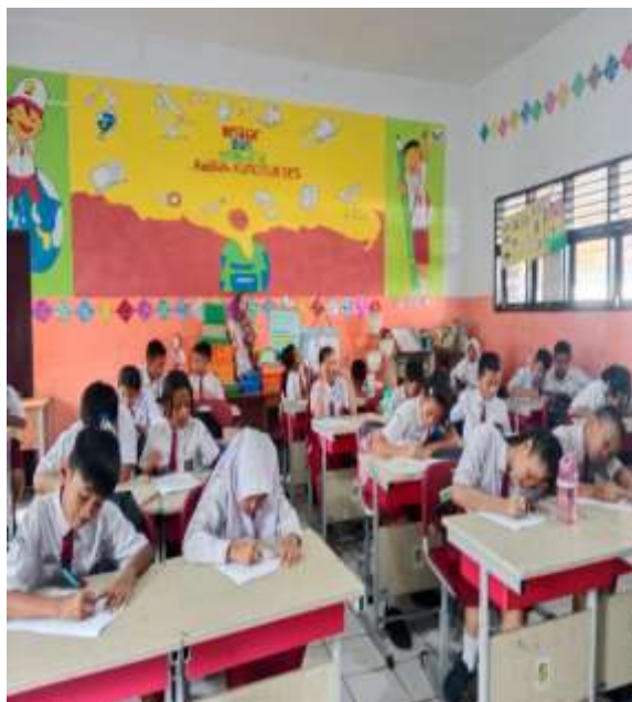
Pengisian Angket Respon Peserta Didik