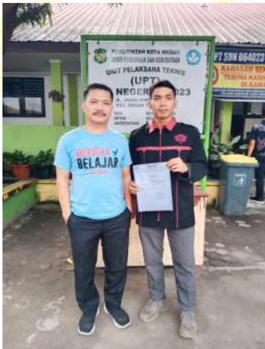
Foto Bersama Kepala Sekolah SD NEGERI 064023