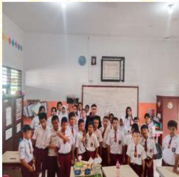
Foto Bersama Siswa Kelas VI B