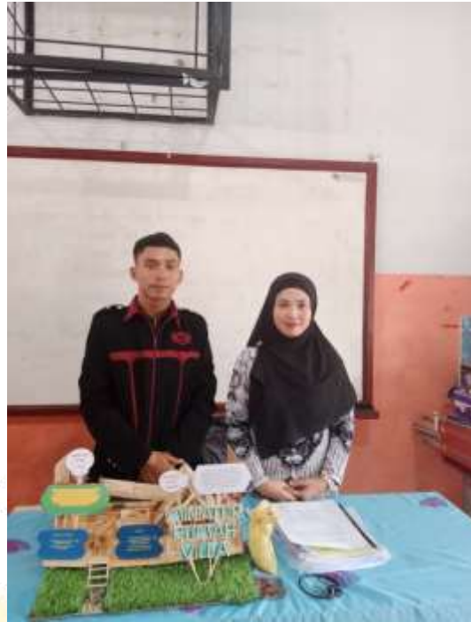
Foto Dengan Wali Kelas VI B