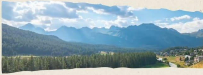
Sumber Daya Alam non-Hayati Sumber Daya Alam bukan berasal dari Mahluk Hidup Misalnya: Matahari, Air, Udara