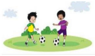
Gambar 2. 3 Gaya terhadap bola dengan cara menendang.

Peristiwa di atas menggambarkan benda yang bergerak. Apakah penyebab gerak benda sama? Kalau kamu perhatikan, penyebab gerak benda itu berbeda-beda. Menendang, mendorong, menarik, disebut mengerjakan gaya. Nah, sekarang sudah jelas bahwa benda dapat bergerak karena mendapat gaya.