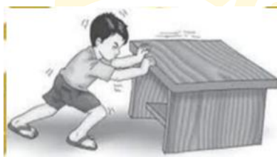
Gambar 2. 2 Orang mengerjakan gaya terhadap meja dengan cara mendorong sehingga meja bergerak dan berpindah tempat.