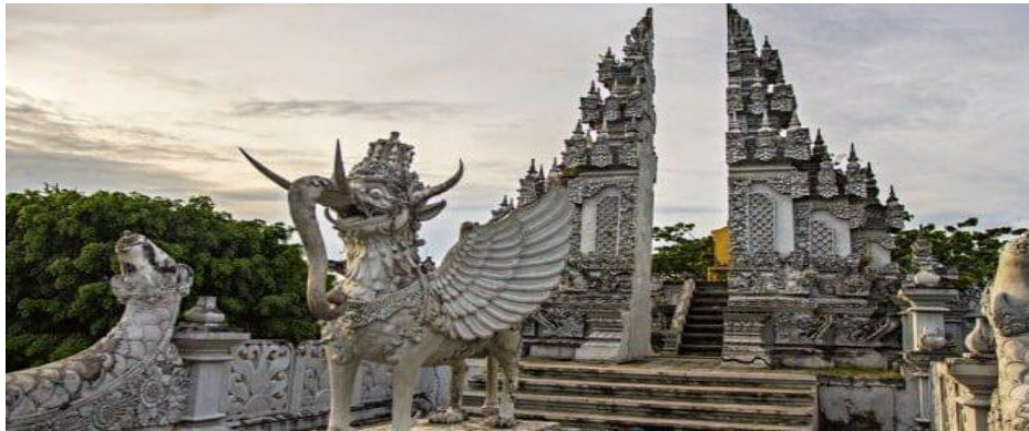
Gambar 2.1 Kerajaan kutai

terletak di hulu Sungai Mahakam, Muara Kaman (kini termasuk wilayah Kabupaten Kutai Kartanegara). Beberapa raja yang pernah bertakhta di Kutai antara lain Kudungga, Aswawarman, dan Mulawarman. Salah satu peninggalan Kerajaan Kutai adalah Prasasti Tugu Batu yang di dalamnya terdapat huruf Pallawan .