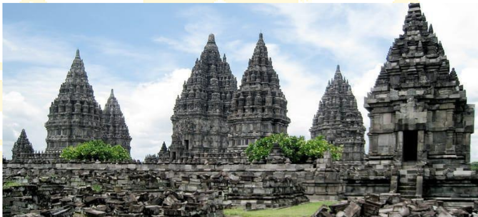
Gambar 2.3 Kerajaan Mataram Kuno

Sejarah Kerajaan Mataram Kuno atau Kerajaan Medang yang bercorak Hindu dimulai sejak abad 6 Masehi. Kerajaan ini merupakan kerajaan penerus dari Kerajaan Kalingga. Kerajaan Mataram Kuno memiliki dua periode berdasarkan lokasi atau ibu kota pemerintahannya. Pertama, periode awal di Jawa Tengah pada era Wangsa Sanjaya dan Sailendra (732-929 M), kedua ketika pindah ke Jawa Timur dan dikuasai oleh Wangsa Isyana (929-1016 M). Raja-raja yang memerintah Kerajaan Medang sebagian besar memakai gelar Rakai, di antaranya adalah Rakai Mataram Sang Ratu Sanjaya (732-760 M), Rakai Panangkaran (760-780 M), Rakai Panunggalan (780-800 M), dan seterusnya. Kerajaan Mataram Kuno punya banyak peninggalan yang berupa candi-candi.