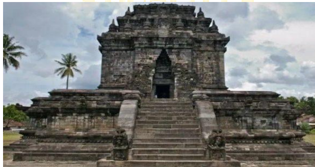
Gambar 2.2 Kerajaan Tarumanegara

Kerajaan Tarumanegara pada (450 Masehi) pernah menguasai kawasan yang kini menjadi wilayah Banten, Jawa Barat, dan DKI Jakarta. Kerajaan Tarumanegara mengalami masa kejayaan di bawah pimpinan Raja Purnawarman. Beberapa prasasti peninggalan kerajaan ini antara lain Prasasti Muara Ciaruteun, Prasasti Kebon Kopi, Prasasti Tugu, Prasasti Jambu, Prasasti Lebak, dan lainnya.