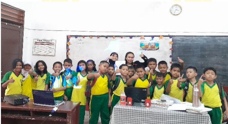
Dokumentasi Bersama Murid-murid Kelas IV SDN 060922 Medan