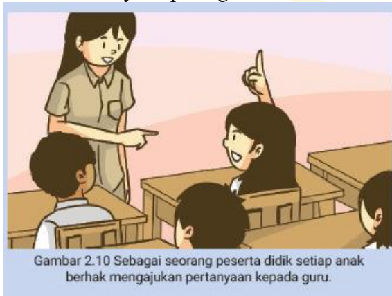
Gambar 2.10 Sebagai seorang peserta didik setiap anak berhak mengajukan pertanyaan kepada guru.