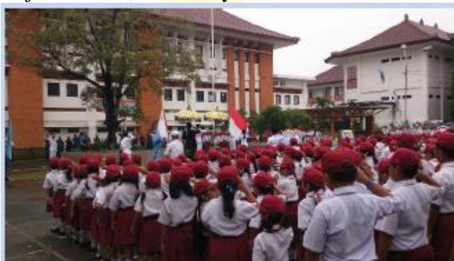
Gambar 2.13 Salah satu kewajiban anak di sekolah adalah mengikuti upacara bendera

Semua peserta didik harus memakai seragam supaya terlihat rapi. Setiap peserta didik wajib mengikuti upacara bendera hari senin. Pada saat upacara bendera berlangsung, kalian tidak boleh berbicara. Kalian harus mengikuti semua tahapan upacara seperti penghormatan pada bendera merah putih, membacakan Pancasila, menyimak amanat pembina upacara, menyanyikan lagu wajib nasional, dan lainnya.