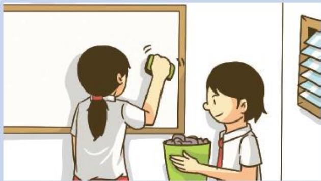
Gambar 2.11 Setiap anak selain mempunyai hak juga mempunyai kewajiban yang harus dilaksanakan.

g. Hak mendapatkan sarana belajar seperti buku, meja, dan kursi yang baik.