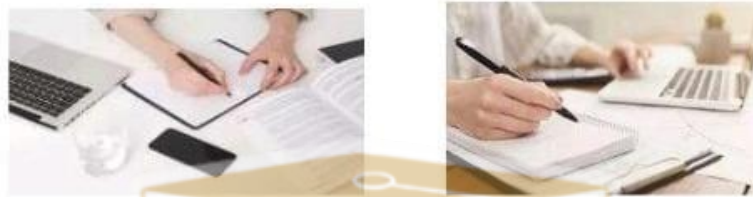
Gambar 3.1 Alat/Sarana Penelitian Normatif.

Instrumen penelitian yang digunakan adalah instrumen penelitian dokumentasi. Dokumentasi merujuk pada barang-barang tertulis. Instrumen ini memungkinkan peneliti memperoleh data melalui penelitian terhadap benda-benda tertulis, seperti buku, majalah, catatan harian, video dan lain sebagainya. Instrumen ini dikembangkan dalam penelitian dengan pendekatan analisis isi. Oleh karenanya biasanya digunakan dalam penelitian seperti bukti-bukti sejarah, landasan hukum suatu peraturan, dan lain sebagainya.