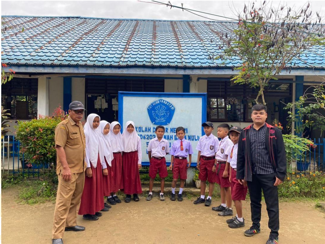
Foto bersama siswa dan kepala sekolah