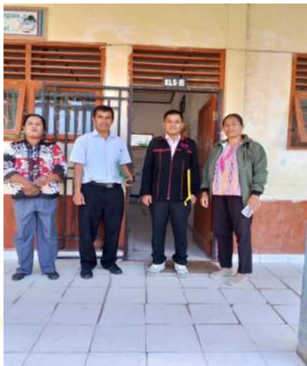
Foto Bersama Kepala Sekolah, Guru Kelas III a, IIIb UPT SD Negeri 173422 Pollung