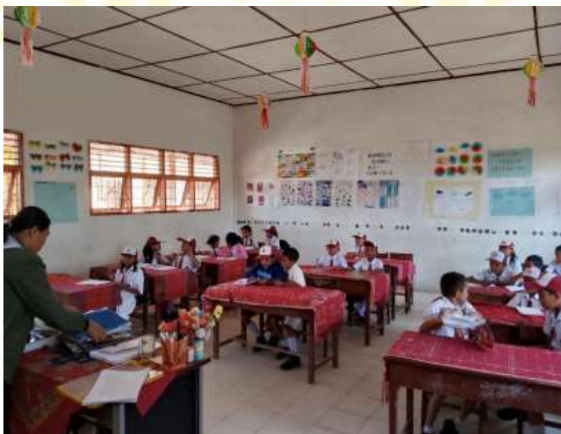
Foto Guru Memberikan Arahan Pada Siswa