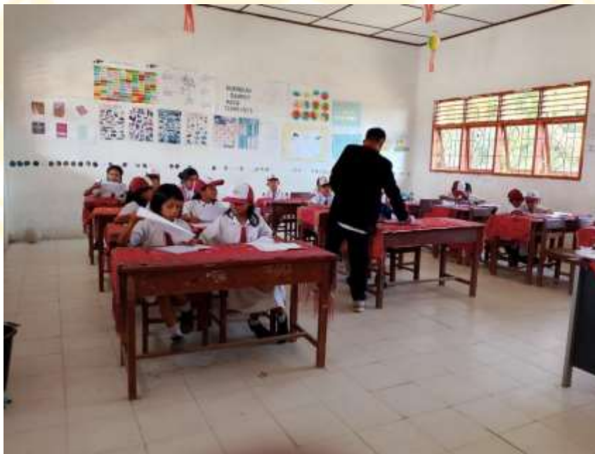
Peneliti Memberikan Soal Pretest dan Posttest