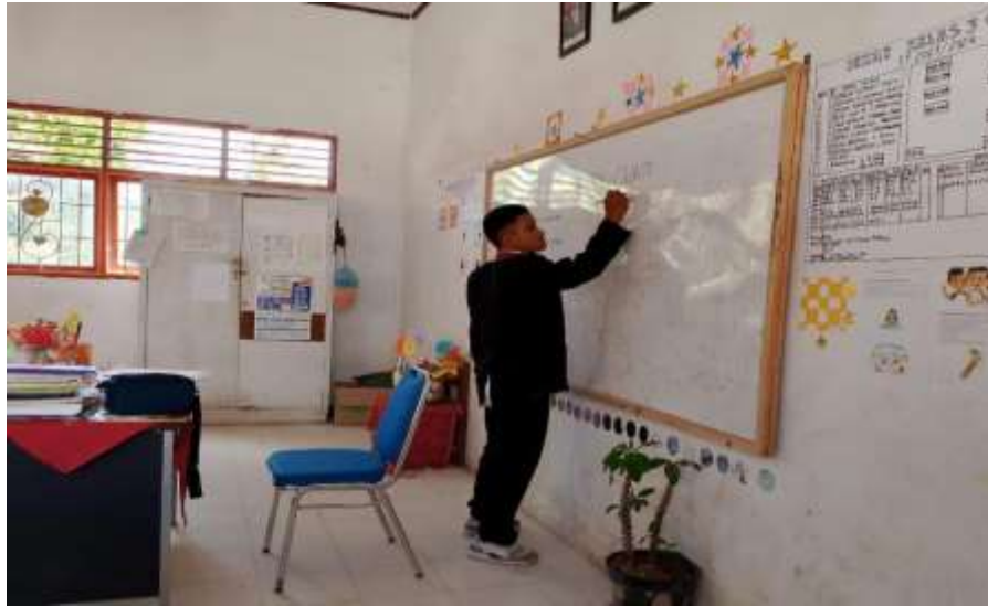
Foto Peneliti Memulai Materi