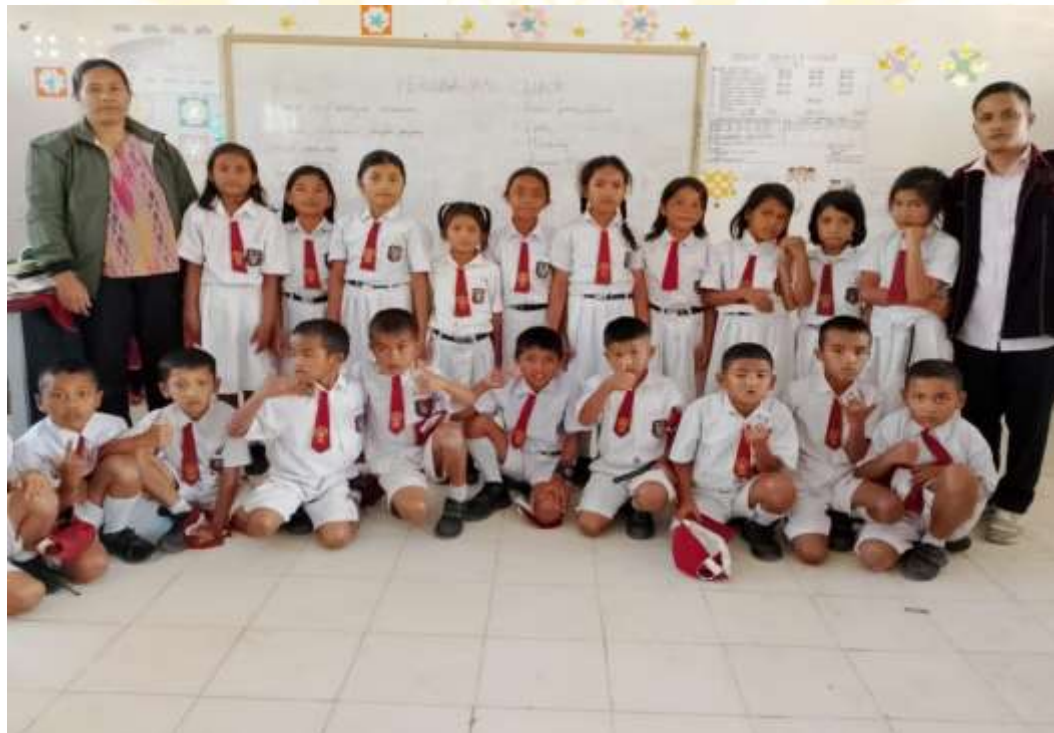
Foto Bersama Kelas III B