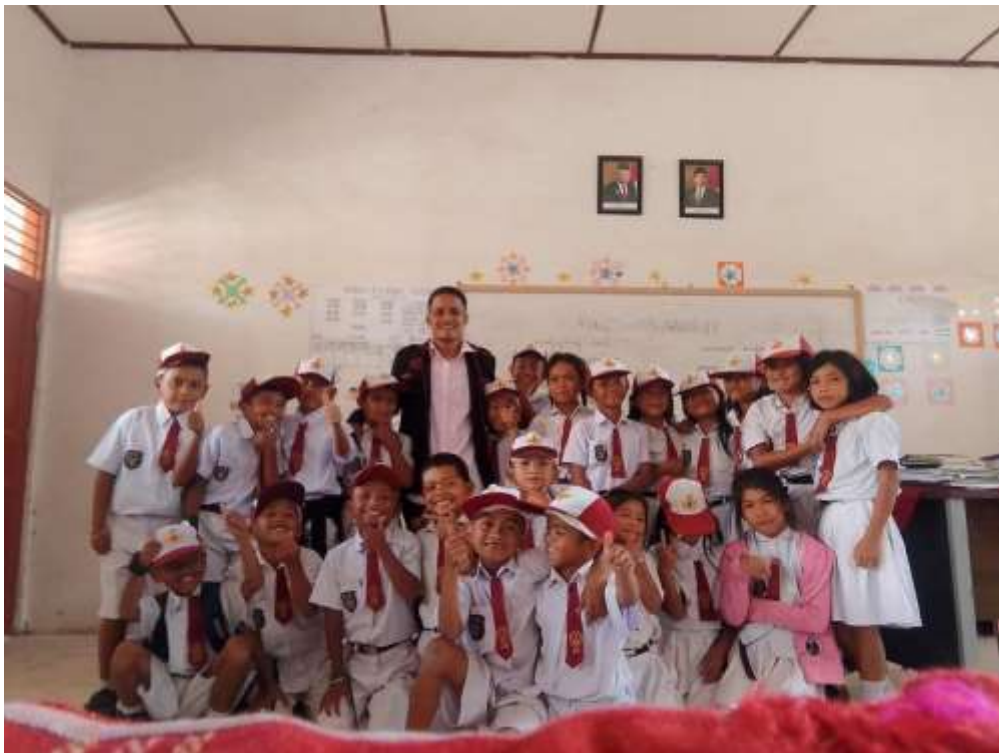
Foto Bersama Siswa Kelas III A