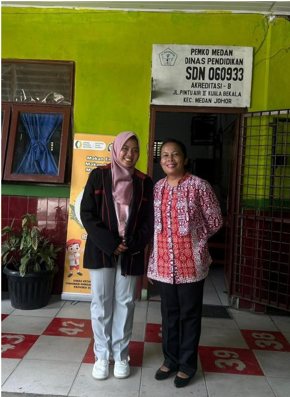
Foto bersama ibu kepala sekolah SDN 060933 Medan Johor