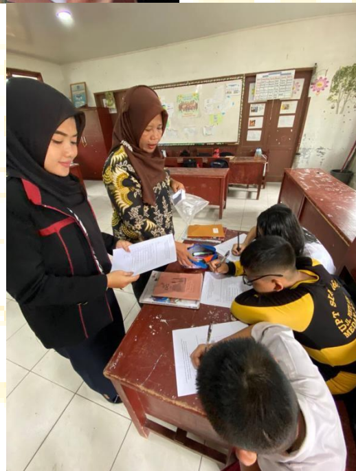
Pembagian Angket Respon Peserta Didik terhadap media