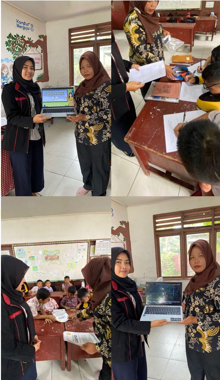
Foto bersama guru walikelas V SDN 060933