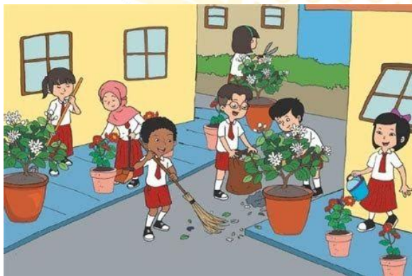
Gambar 2. 1 Bekerja Sama Membersihkan Lingkungan Sekolah