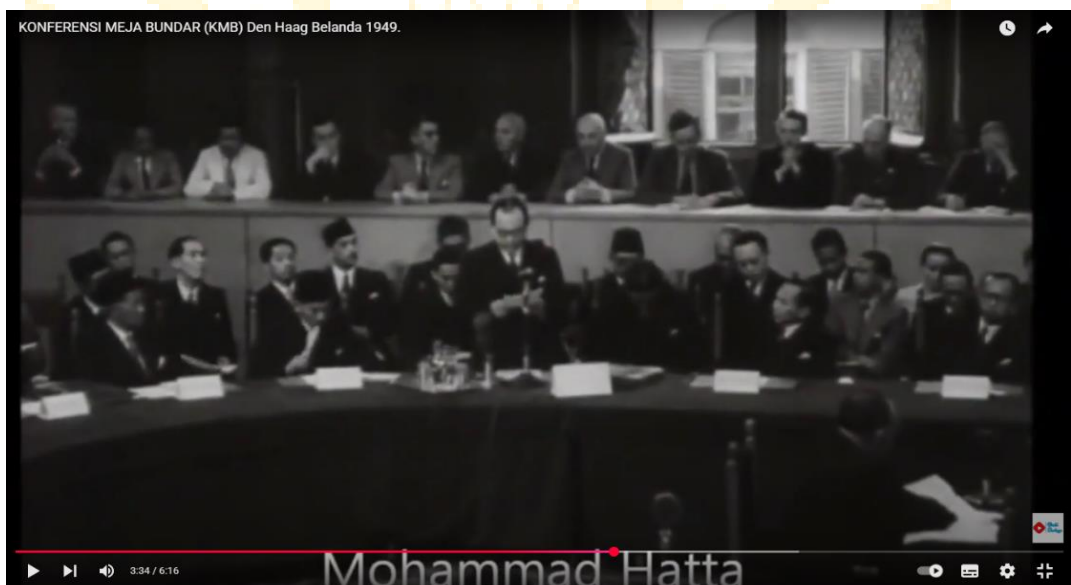
Gambar 2.1 Konferensi Meja Bundar di Den Haag