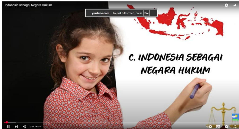
Gambar 2.7 Pancasila