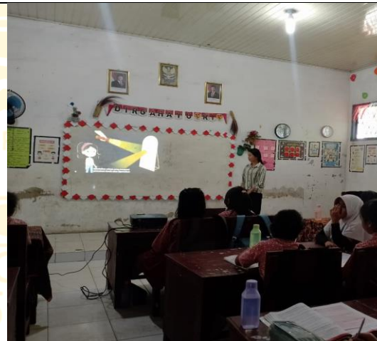
Menonton Video Animasi Sifat Sifat Cahaya