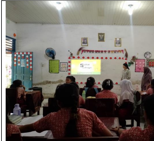
Menonton Video Animasi Kelas Va