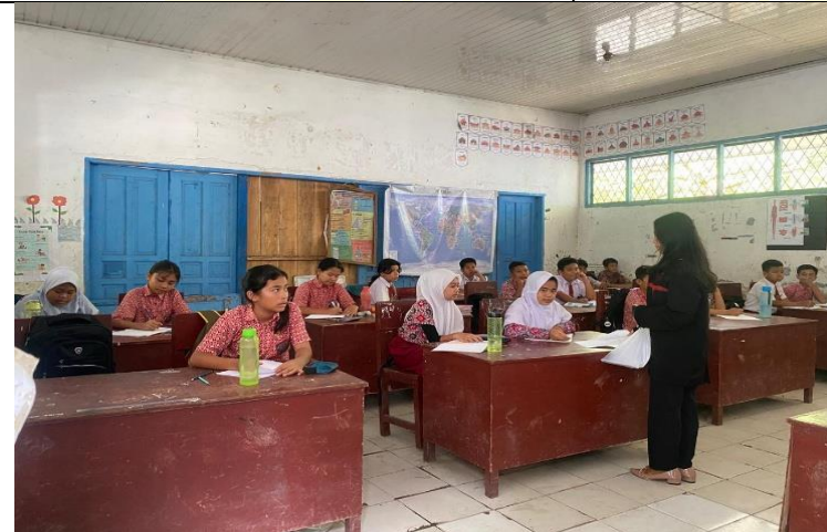
Pembagian soal Pretest Dan Mengerjakan Soal Pretest Kelas Vb