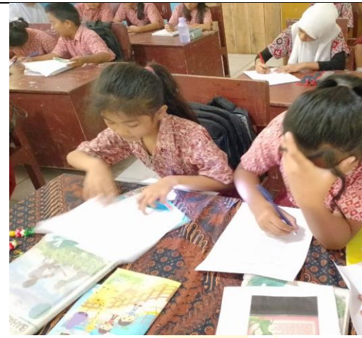
Mengerjakan Soal Pretest Kelas Va