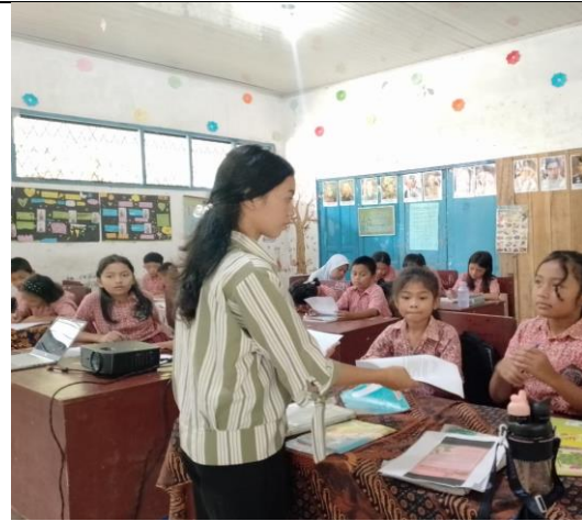
Membagikan Soal Pretest Kelas Va