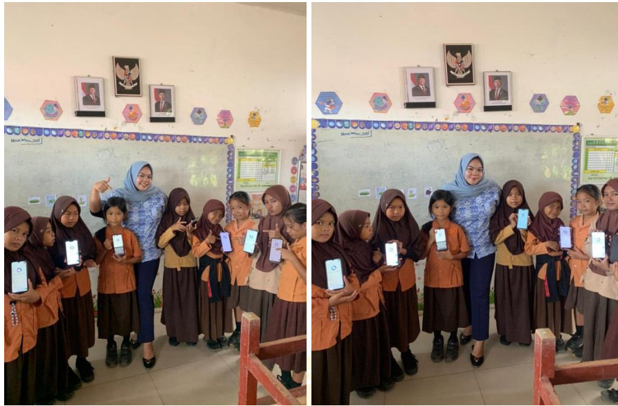
Hasil Penggunaan Media Meta AI Pada Siswa Kelas Eksperimen