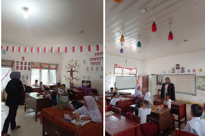
Pembagian Pre-test dan Post-test Pada Kelas Kontrol