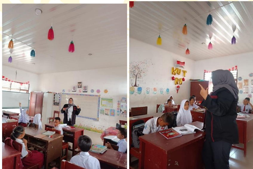
Perlakuan Kelas Kontrol dengan Metode Pembelajaran Konvensional