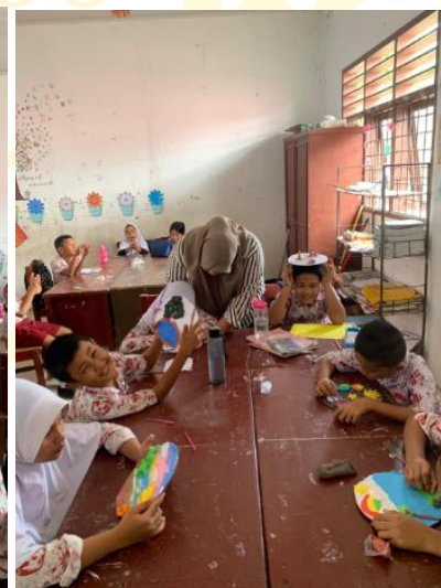
Pembagian Pre-test dan Post-test Pada Kelas Eksperimen