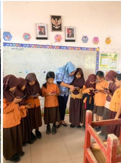
Penggunaan Media Meta AI pada Siswa Kelas Eksperimen