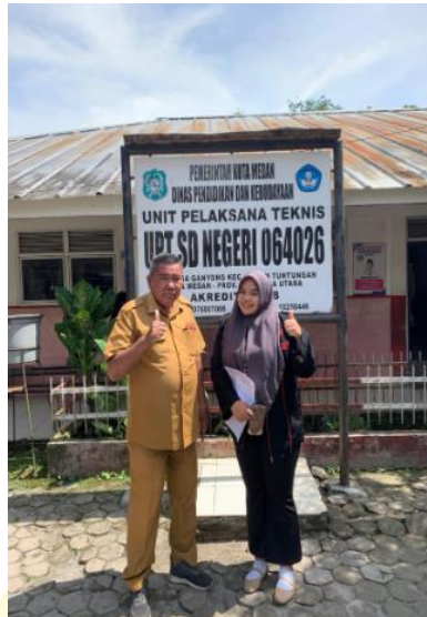
Foto bersama Kepala Sekolah UPT SD Negeri 064026