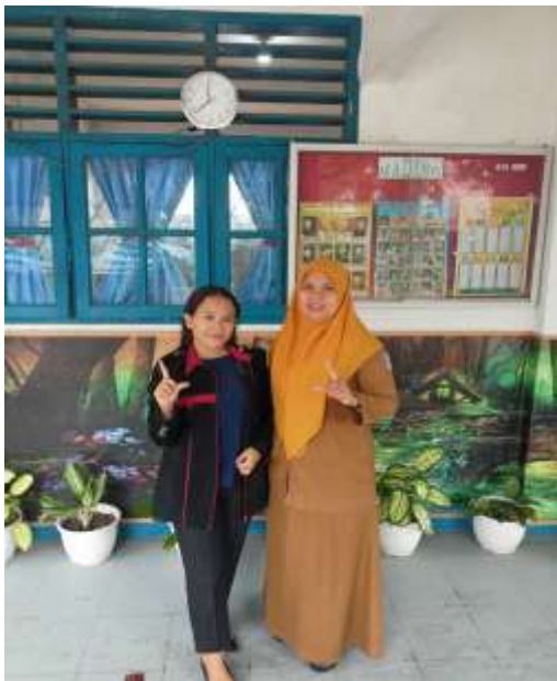
PHOTO BERSAMA WALI KELAS V-A