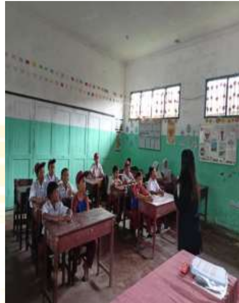
Photo Post Test