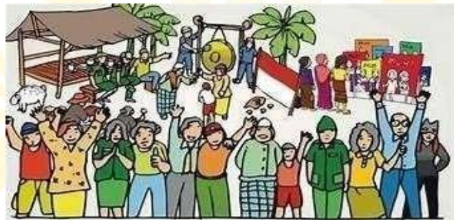
Gambar 2.1.8 Contoh Masyarakat Yang Beradab

Manusia memiliki sifat dan karakter yang berbeda-beda. Namun kita hidup berdampingan. Seperti bersama keluarga, warga sekolah dan masyarakat. Agar hidup rukun perlu adanya alat yang mempersatukan, yaitu peraturan. Apakah peraturan itu sama di semua tempat? Siapa yang membuat peraturan? Apa yang terjadi jika tidak ada peraturan? Masyarakat yang beradab adalah kelompok orang yang hidup bersama dengan sopan santun, saling menghormati, dan mengikuti aturan yang baik. Seperti keluarga besar yang rukun dan damai.