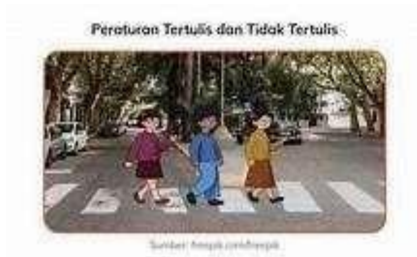
Gambar 2.1.8 Peraturan Tertulis Dan Tidak Tertulis